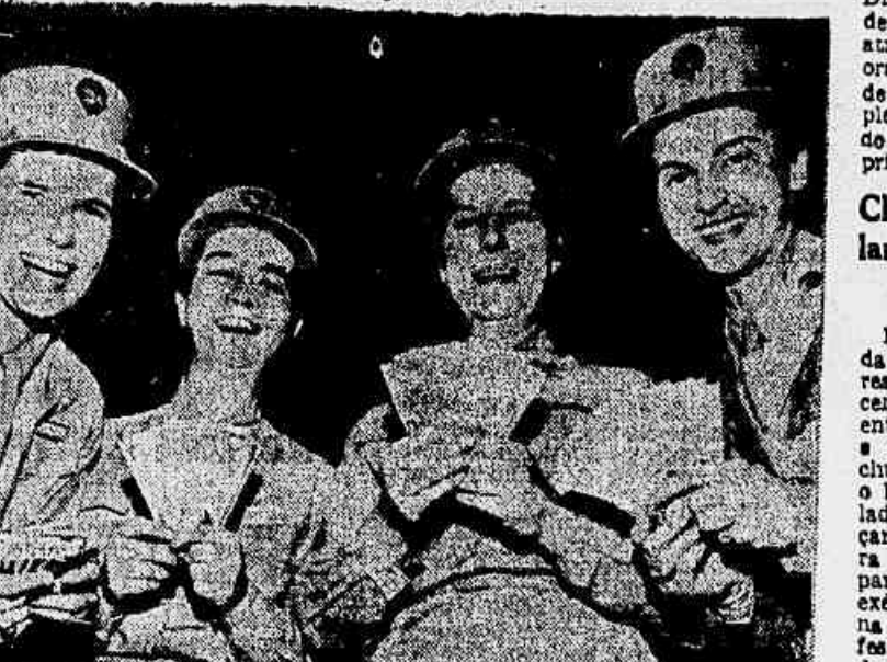
DEPOIS DE RECEBER O SOLDADO — Quatro componentes da WAAC mostram-se sorridentes depois de receber o soldo relativo ao mês que passou. As mulheres do Corpo Auxiliar Feminino do Exército norte-americano recebem o mesmo pagamento dos soldados. Uma auxiliar ganha cinquenta dólares por mês e as graduadas muito mais.