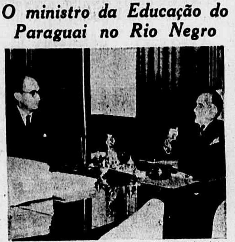
O ministro da Educação do Paraguai em flagrante jacto quando palestrava com o chefe do governo.