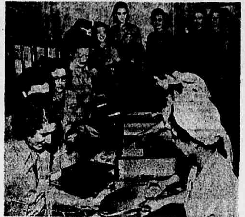
CHEGA A HORA DO RANCHO — Em fila, de bandeja na mão, as auxiliares da WAAC vão recebendo o "rémú" do dia, no Osceola Hotel, em Daytona Beach.

Nestas colunas já tejos, por mais de uma vez, ressaltado a ação da mulher norte-americana nessa mobilização gigantesca em todos os sentidos que é o esforço de guerra dos Estados Unidos. Dos mais recônditos lugares das cidades mais adiantadas da Norte-América, nota-se entre o elemento feminino um dinamismo de deixar o observador menos atento surpreendido ante a atividade que tem frente a si. A colaboração da mulher norte-americana na luta sem tréguas contra o nipo-nazi-fascismo vem sendo uma das páginas mais bonitas das Nações Unidas, nesta guerra. No conjunto de gravuras que aqui, hoje, estampamos, vemos várias passagens das atividades quotidianas das componentes da "WAAC".