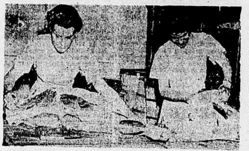
PREPARANDO O ALMOÇO — Duas auxiliares da WAAC em plena atividade culinária preparando a alimentação de suas companheiras. A alimentação das mulheres do Corpo Auxiliar feminino norte-americano é bastante sadia e preparada por excelentes cozinheiras.