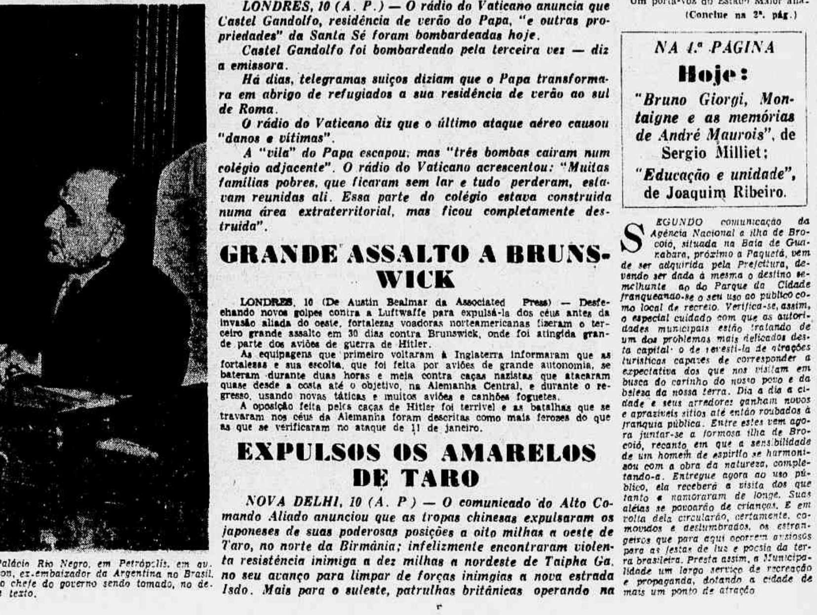
Para apresentar suas despedidas foi recebido, no tarde de ontem, no Palácio Rio Negro, em Petrópolis, em av. presidente Getúlio Vargas, o general Arturo Rawson, ex-embaixador da Argentina no Brasil. O diplomata da nobre república amigal-petrou alguns momentos com o chefe do governo sendo tomado, no decorrer da audiência, o flagrante que ilustra este texto.