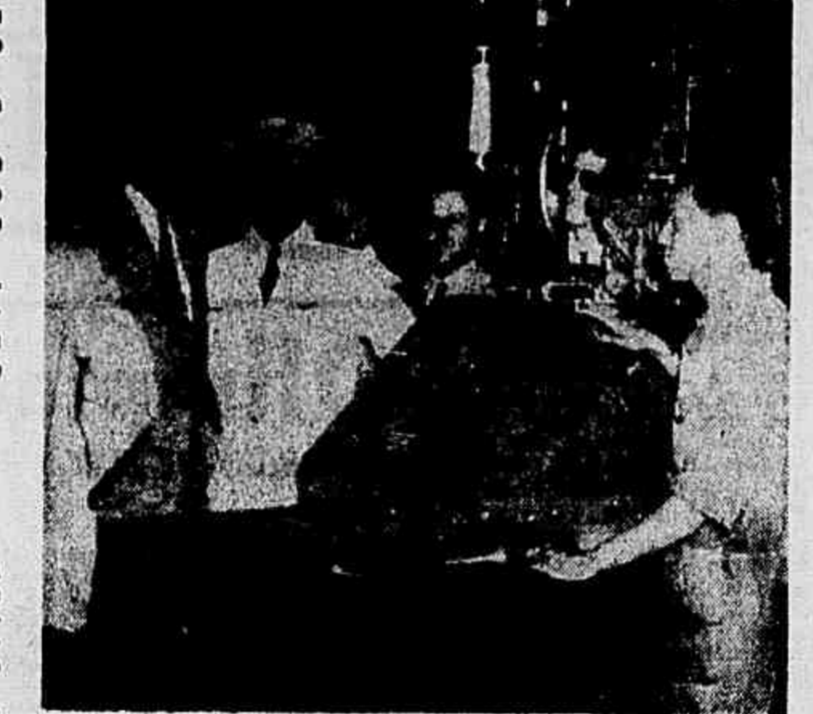
exprimindo o nosso esforço pela emancipação total da nossa terra das velhas injunções nascidas de uma falsa noção das nossas possibilidades de produção. Essa obra, parte do conjunto gigantesco em