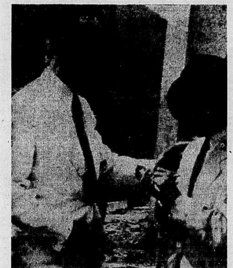
que se controla o novo Brasil, é a demonstração mais eloquente e mais impressionante da energia do governo Getúlio Vargas, capaz de enfrentar todas as resistências e vencer todas as indecisões para cumprir fielmente o seu programa de reforma nacional em todos os sen-