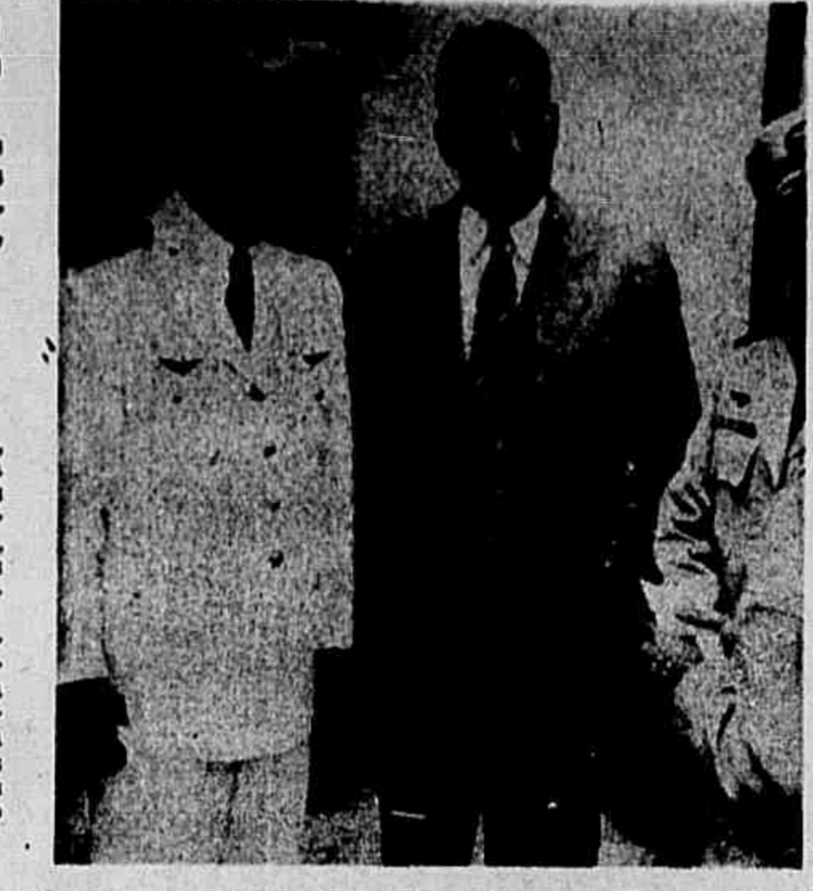
bituadas aos espaldos dessa classe não esconderam a admiração pela obra e pela patriótica clarividência dos seus idealizadores. Realmente, a Fábrica Nacional de Motores é um monumento bem atual,

Aproveitando a visita de um grupo de personalidades à Fábrica Nacional de Motores, A MANHA focalizou alguns aspectos daquele soberbo marco da grandeza atual do Brasil, diante do qual figuras ha-