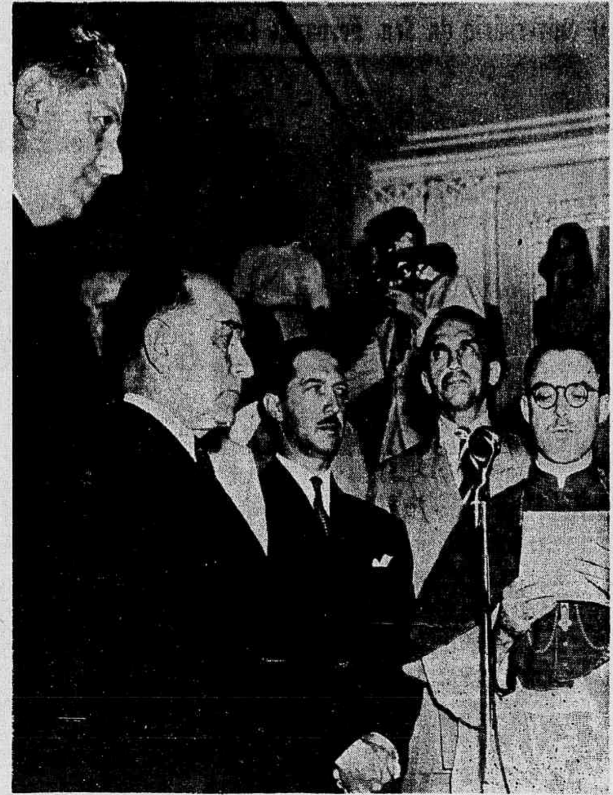
Entre as várias iniciativas com que Araxá comemora a visita do presidente Getúlio Vargas, figura a inauguração das termas, melhoramento que coloca a estância mineira entre as mais modernas do mundo. Durante o ato inaugural, quando D. Alexandre Amaral, dispo de Uberaba, pronunciou a sua oração, o fotógrafo ficou o flagrante que acompanha estas linhas, vindo-se o presidente e o governador Benedito Valadares ouvindo o orador.

5 De Washington noticiam que a sra. Roosevelt declarou durante um jantar, no Clube Nacional Democrático Feminino, que escapou duas vezes da possibilidade de ataques de dois submarinos na área das Caraíbas, quando em excursão para as bases norte-americanas no mês de março, graças à rigorosa vigilância das forças de patrulha.