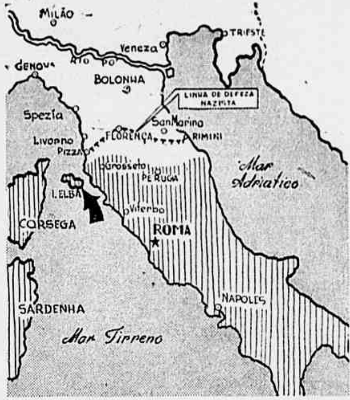
Não resistindo à fulminante investida das forças aliadas, o marechal Kesselring está recuando para a linha Piza-Florença-Rimini onde espera oferecer resistência às tropas do general Clark, pois com a tomada de Grissolo, Perugia e Assis, ficou totalmente inutilizada a antiga linha de defesa que os nazistas haviam improvisado naquele setor. O nosso mapa de hoje apresenta a parte central e setentrional da "bola" italiana, tendo-se a linha Piza-Florença-Rimini e indicada por uma seta negra, a histórica ilha de Elba — onde Napoleão esteve desterrado — agora inicialmente em poder das forças francesas, que conseguiram libertá-la definitivamente do domínio dos homens de Hitler.

As fortificações da cidade As fortificações de Cherburgo se dividem em três zonas: Primeira — Defesas puramente costeiras, incluindo poderosas fortificações fixas. Segunda — O perímetro interno de defesas se estende entre 3 e 5 quilômetros do centro da cidade. Essas duas zonas constituem conjuntamente sete poderosos fortes, que talvez pudessem resistir tenazmente, embora sejam principalmente destinados a receber ataques por mar, e sua adaptação para repelir ataques terrestres seria difícil. Terceira — O perímetro exterior, de 8 a 9 quilômetros distante do porto, se estria em montes quasi a pique, difíceis de atacar, pelo que não é fácil julgar si a tentativa de desenvolver a parte norte-americanas, em sua marcha através da península, conseguirá esmagar as defesas exteriores e dominar a cidade em curto tempo, ou si o general Bradley terá que fazer alto e movimentar reservas, enquanto a artilharia abrir passagem para a cidade.