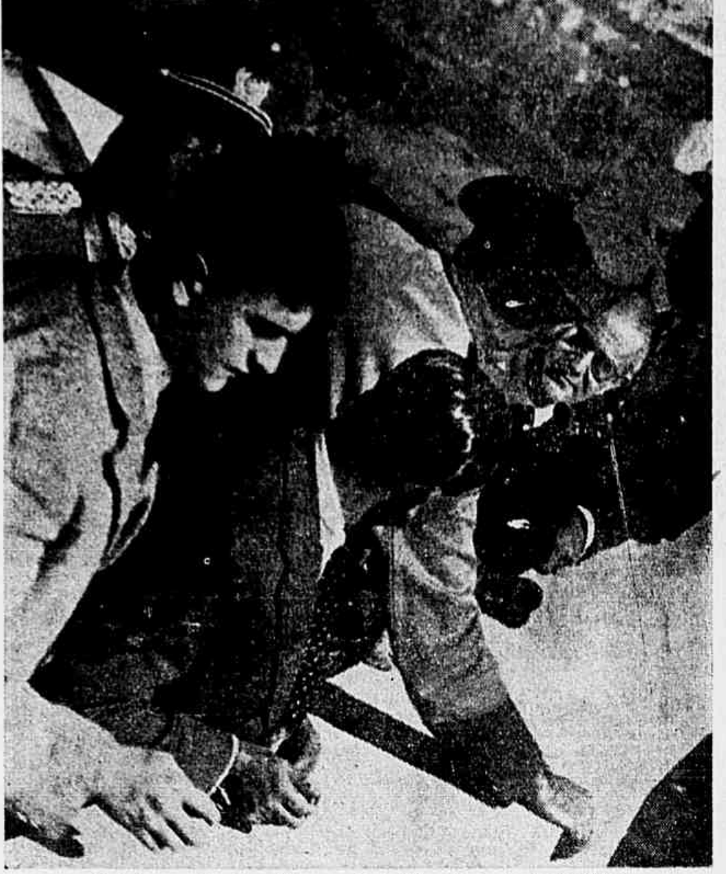
Ouvindo as explicações relativas ao Posto Meteorológico da Escola Militar

Analistas colombianos, que o interrompem para esclarecimentos, isolado de todos os convidados, inclusive os chilenos e colombianos, se, depois, a visita à parte central do estabelecimento, onde estão os alojamentos dos cadetes, e a sala de aula, os magníficos e perfeitos laboratórios, salas especializadas, gabinetes de estudo, tudo, no aparelho e na disposição, é de excelente qualidade e bom nível.