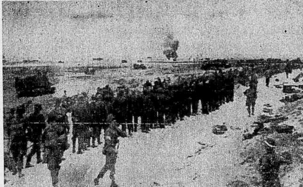
I — Agentes da morte e da destruição avançam apoiando as forças invasoras do continente. Vêm-se nitidamente as bombas caindo sobre a costa francesa, "amaciando" o terreno em que vão pisar os americanos. Depois, os alemães alegriam que cuidavam que tudo aquilo fosse apenas mais um ataque aéreo... II — Máquinas de invasão atacam as linhas alemãs, e estas vão suprir os pontos fracos, parecendo estremeecer as defesas que Hitler afirmava intransponíveis. III — Tropas americanas apresentam armas pelos seus camaradas que tomaram na luta, e que foram sepultados temporariamente num cemitério da "cabeca de praia". IV — Esta longa linha de prisioneiros alemães, é uma parte, estimado em 5.000 homens, dos primeiros soldados nazistas capturados no dia da invasão do continente.