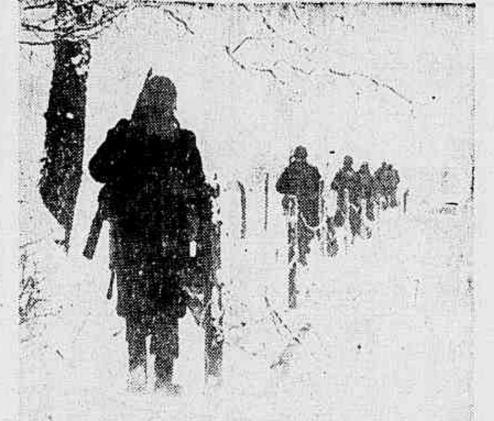
Infantes do 3.º Exército, de Patton, vestidos com roupas apropriadas para o inverno, abrem caminho através de campos abertos de neve para ocupar Striboib, na arremada sobre Houffalize.