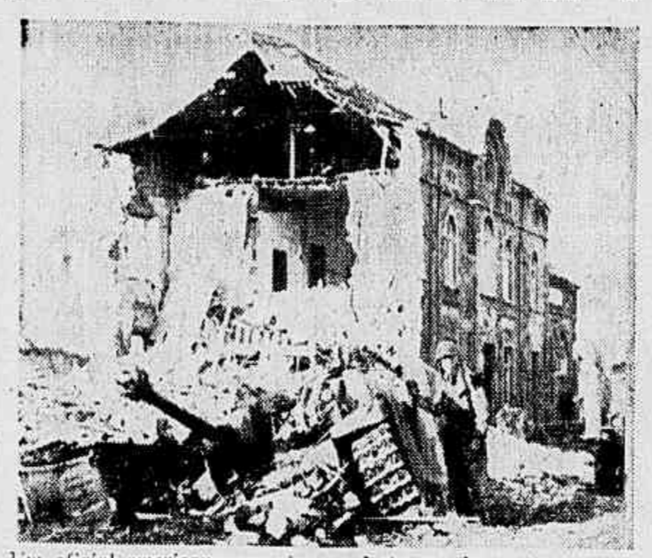
Um oficial americano examina os destroços de um tanque na pista destruída pela aviação aliada. A casa, ao fundo, mostra o efeito do bombardeio, no front do 3.º Exército americano.