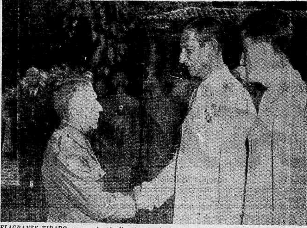
FLAGRANTE TIRADO em um dos jardins da residência de Moraes que foi conferida a este oficial pelo Exército dos Estados Unidos haver condecorado o general Mascarenhas de Moraes com a Estrela Militar.

O apelo do Conselho da Juventude constitui mais um indicio da tendência a solidificar a união dos esquerdistas com os anticomunistas do centro.