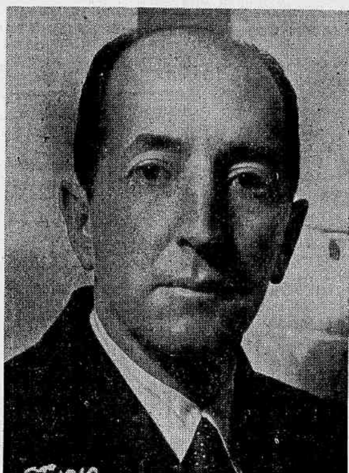
Cel. Ernesto Dornelles, interventor federal no Rio Grande do Sul exaltado, atuando para os títulos do Rio Grande e o interesse e a confiança dos capitais do dentro e fora do Estado.

De o exposto, fica saliente a magnífica situação financeira do Estado no exercício que findou, convido, mais uma vez, desamar que todos os serviços de pagamento do Tesouro, continuam perfeitamente em dia, atendidos pontualmente não só os funcionários em seus vencimentos, como as fornecedores do Estado em suas contas. O serviço da Dívida Pública mantém-se no mesmo ritmo de absoluta