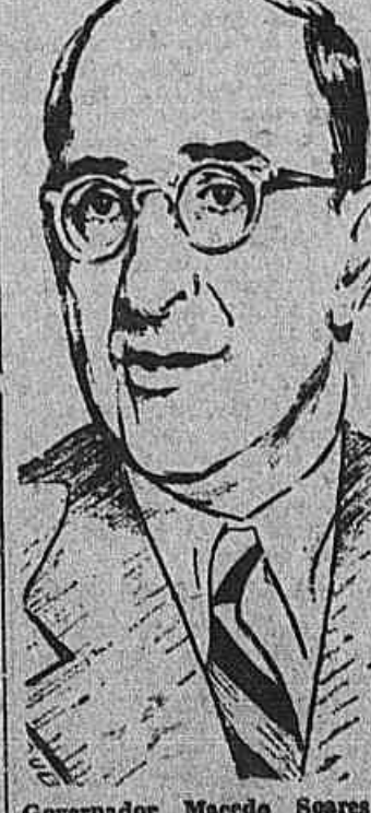
Governador Macedo Soares e Silva