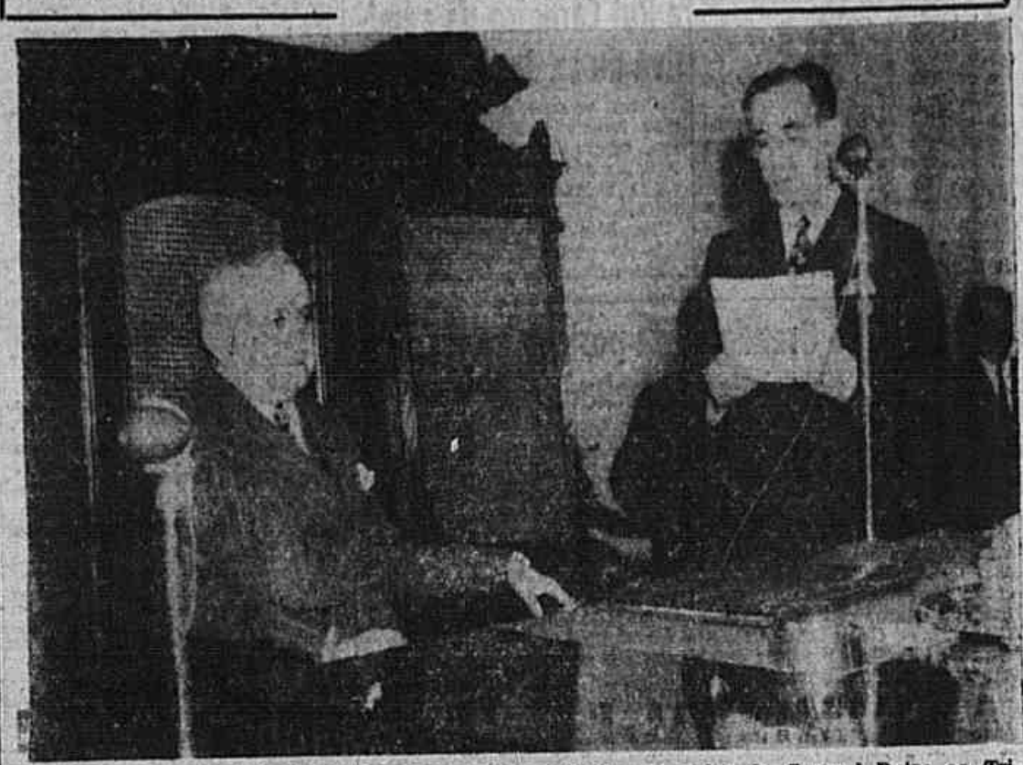
Damos na primeira página desta edição amplo noticiário da visita do General Dutra ao Tribunal de Contas, que se revestiu de excepcional importância, sendo essa a primeira vez que um chefe de Estado visita aquela corte. O flagrante acima foi tomado na ocasião em que o presidente do Tribunal, Ministro Joaquim Henrique Coutinho saudava o primeiro magistrado da Nação