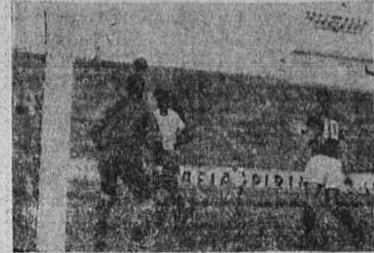
Fase do primeiro treino entre o Flamengo e a seleção A

Sabe-se, apenas, que os dois "scratches" treinarão contra o Bangu e o Flamengo — Quem irá enfrentar o quadro A! — Augusto, só meio tempo