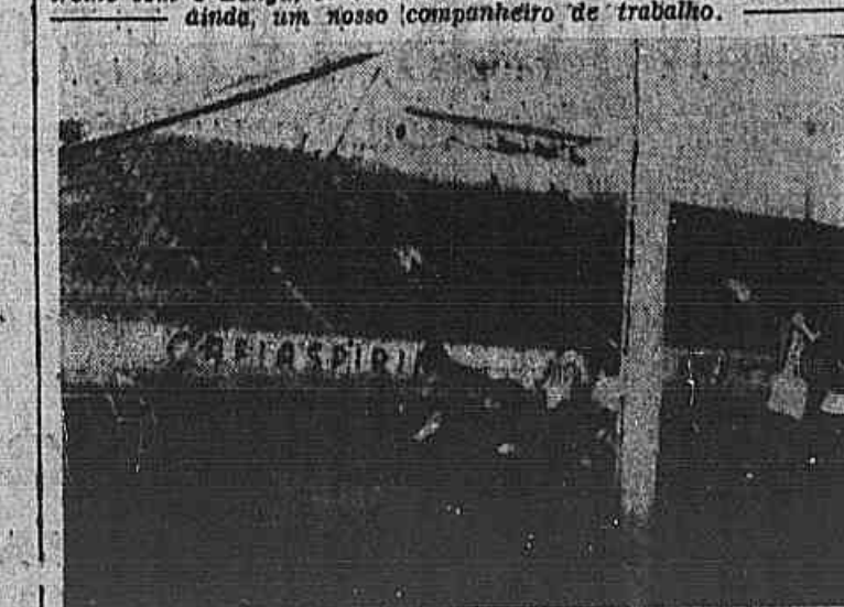
"GOAL" DE BALTAZAR — Baltazar, o "cabeca de ouro" dos paulistas, ensaiou muito bem. E' um centro-avante de futuro. Vemos na gravura o "goal" feito pelo famoso atacante paulistano, no ensaio contra os banguenses.