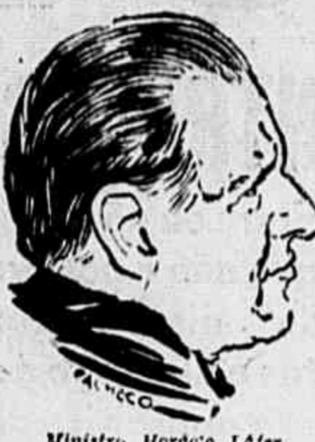
Ministro Horácio Lafer

Assinala, a data de hoje, a passagem do aniversário natalício do sr. Horácio Lafer, ministro da Fazenda.