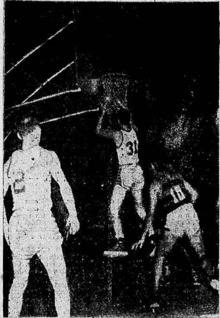
Um aspecto do jogo All Stars x Flamengo, vencido pelos "brancos" americanos.

Os negros e os brancos americanos em confronto — Flamengo e A. A. Grajaú, uma "revanche" que promete — Mais dois jogos no D. Federal