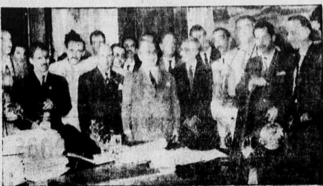
NO CATETE, UMA COMISSAO DA ASSOCIACAO DE FOTOGRAFOS DO RIO — O presidente da Republica recebeu, ontem, no Palácio da Catete, uma delegação da Associação de Fotografos do Rio de Janeiro, que, em nome da classe, apresentou cumprimentos ao Chefe do Governo e, ao mesmo tempo, a S. E. a. os assuntos de maior interesse, principalmente, os que dizem respeito aos problemas imediatos desses profissionais. Na foto acima, um flagrante tomado durante a audiência.

S. PAULO, 2 (Asapress) — A fim de reexaminar a situação de seus diretórios municipais, tendo em vista o pleito suplementar de domingo próximo, reuniu-se amanhã a Comissão Executiva Estadual da UDN.