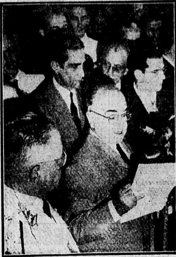
Flagrante colhido quando falava o presidente Getúlio Vargas