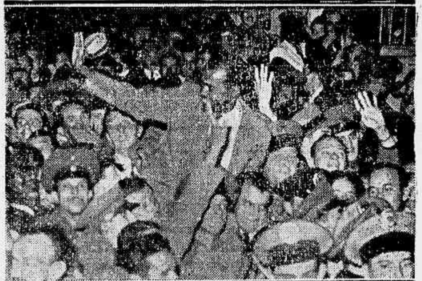
Leonidas era mais do que uma esperança para o S. Paulo. Na "gare" do Norte os sampaulinos receberam-no com manifestações de acen-tuado jubilo.

rante alguns instantes diante do velho ranzinza e responder-lhe: "Um momento, meu amigo! Eu creio que muita gente pode ser o que bem deseja, mas não pode ser Leonidas da Silva. Se o senhor fala em medicos, se bem que a comparação não seja interessante, cite como exemplo, pelo menos um igual a Benedito Montenegro. Este tambem goza de enorme popularidade. Assim como nem todo medico pode ser Benedito Montenegro ou todo poeta como Castro Alves ou Gonçalves Dias, nem todo jogador de futebol pode ser igual a Leonidas da Silva. Em qualquer faculdade, em qualquer escola a gente vê durante anos e anos uma infinidade de moços aprendendo religiosamente as lições para depois colocar uma placa numa casa ou numa sala no centro. Desses todos, porem, apenas poucos conseguem alguma coisa. Assim é em todas as atividades da vida. Esses garotos que vivem pelos campos de futebol dos collegios, das varzeas e dos clubes, são milhares que perdem anos e anos correndo atrás de uma bola de meia ou de camera de ar, para chegar a ser um dia alguma cousa na vida. Eles seguem a sua inclinação porque na vida ou a gente é o que deseja ser, ou então não é nada. Mas não são as noites de sofrimentos, amarguras e decepções que fazem como num passe de magia transformar em Leonidas cada um desses milhares de moleques ou em Benedito Montenegro os estudantes de medicina.