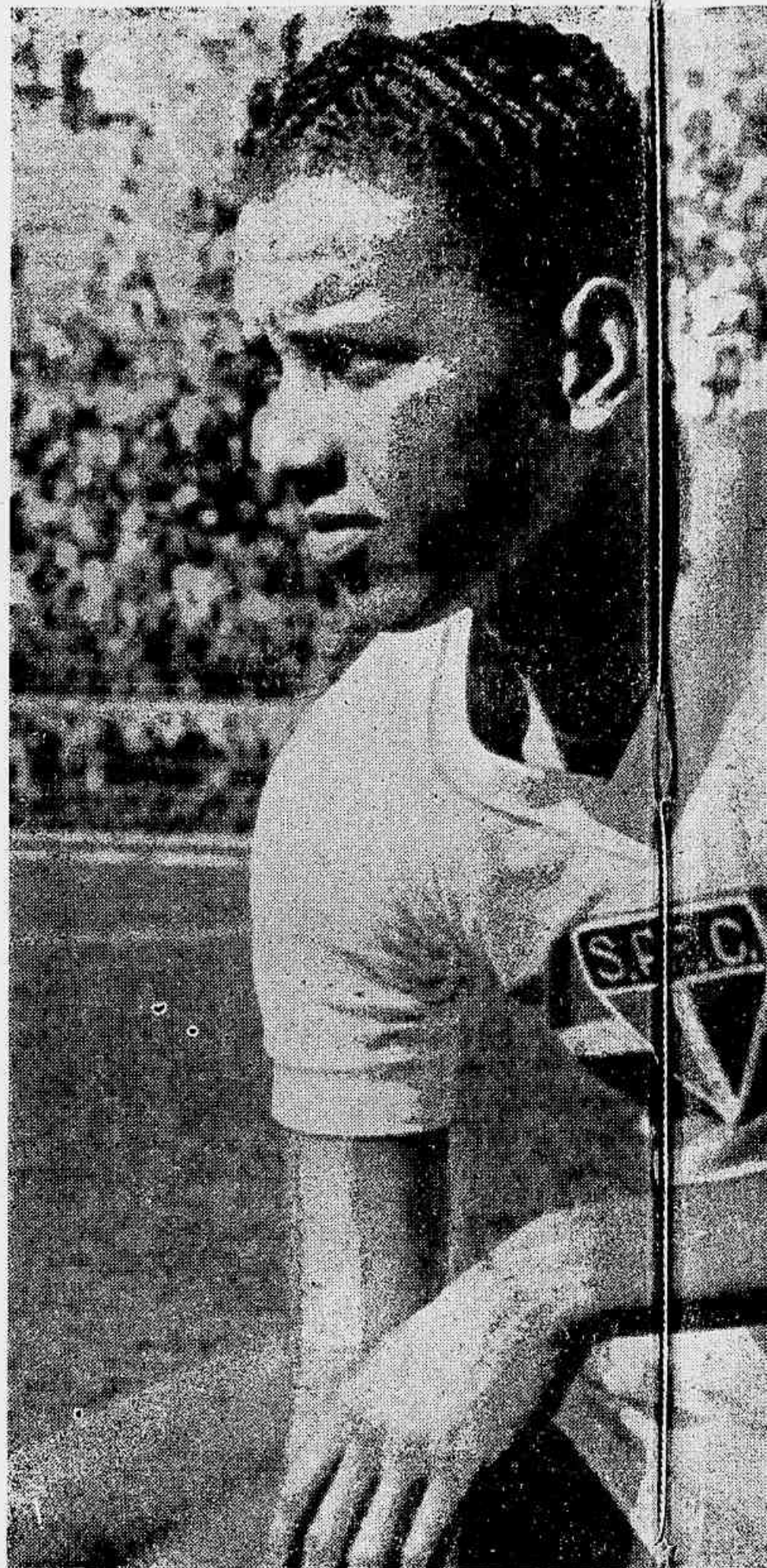
Banco, um dos bons centro-médios do futebol português, com o

7 — Quando se fala em negros heróis, cada um terá um nome para citar. O meu nome predileto é o de Brandão. Grande negro! Tenho por ele a mesma emotiva admiração da preta Bã pelo sinhozinho branco. Perfeito, tecnicamente, o maior entre os maiores, disciplinado, limpo, Brandão é o exemplo do profissional de futebol. Teve a sua época. Não posso nunca me esquecer daquela viagem de trem, quando a delegação paulista do futebol regressava do Rio de Janeiro, com o título de 1943. A festa começou em Cruzeiro. Depois, em todas as estações. O Vale do Paraíba nunca produziu flores mais perfumadas e mais coloridas. Flores que Brandão recebia em bouquets das mãos brancas de lindas moças, flores que caíam sobre a sua cabeça desfeitas em pétalas, atiradas pelas crianças e pelos homens. Pretos e brancos. Só o futebol podia consagrar daquela forma um