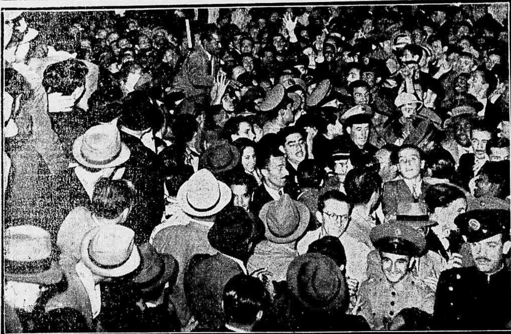
São Paulo esportiva agitou-se quando da chegada de Leonidas. Foi a maior consagração da vida do "Diamante Negro".

Vocês se recordam? Corriam os tempos em que TELECO era o artilheiro dos nossos campos e que o futebol de nossa terra, mais ou menos repleto de jogadores, procurava ganhar o concurso dos grandes ases que se encontravam no Rio de Janeiro. Os paulistas daqueles dias olhavam para a Capital da Republica, com os mesmos olhos de um menino guloso na frente de uma vitrina de doces. Os torcedores sonhavam com Leonidas, Domingos, Peracio e muitos outros. Foi nessa altura que o São Paulo F. C., meio cansado de viver apenas do nome do coração, como se fosse o próprio morro de Manguieira reclamando da sua cantora que deixasse de lado o cartaz, resolveu, num gol-