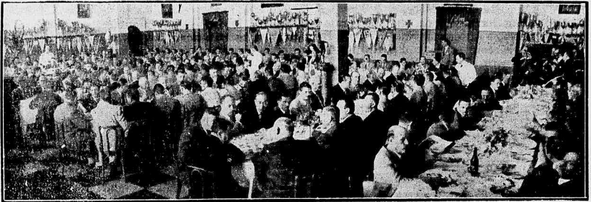
Um aspecto do almoço oferecido pelo Palmeiras em comemoração do seu 33.º aniversário de fundação. Estiveram presentes nesse banquete, altas autoridades esportivas.

O lançamento da pedra fundamental do ginásio palmeirense, como uma das maiores iniciativas de um clube nacional — Um grandioso banquete, em homenagem à imprensa