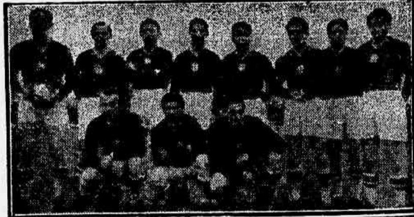
Estes foram mesmo os maiores na V Copa do Mundo! São os húngaros. Perderam o titulo na decisiva, para os alemães, como nós perdemos para os uruguaios em 50. Que grande ataque, o magiar!

"O Brasil é um grande País não tenha duvidas disso! Mas em materia de direção... Todavia, quem sou eu para falar? Há tanta gente a querer salvar o Brasil, mas a verdade é que o povo está desiludido. As eleições, como o numero assustador de abstenções, está provando meridlanamente isso. Eu voto e continuarei votando. É meu dever e o cumpro. Agora, não digo em quem, pois o voto é secreto! Mas vejo o povo sofrer e acho que ele tem razão. Afinal, onde iremos parar? A restria é desenfreada e existem