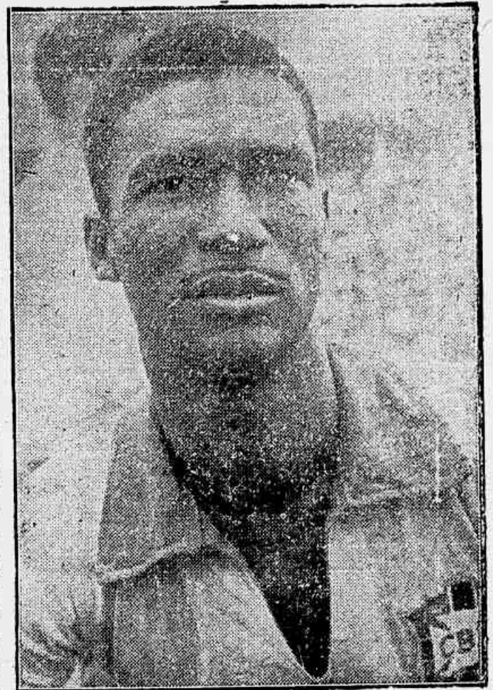
DIDI tem deslumbrado o publico europeu com o seu magnificente futebol

Ninguém acreditava em Gino. Nem mesmo nós. Porem, a verdade é que tem sido um valor utilissimo. Causa imenso transtorno aos europeus