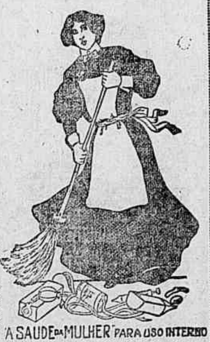
A SAUDE DA MULHER PARA USO INTERNO

Nos casos das outras enfermidades, toma-se A Saude da Mulher de duas a tres colheres por dia, até manifestar-se a cura.