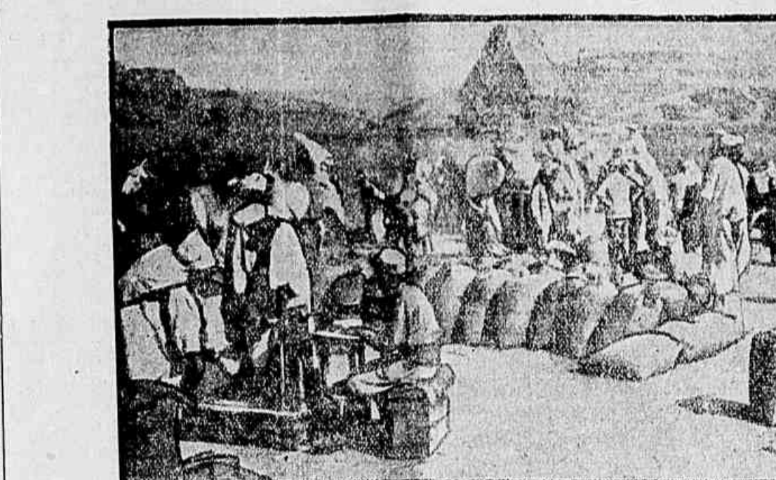
No interior de Marrocos um mercado de trigo

Declarções do ministro da guerra RIO, 25. — O marechal Caetano de Faria, entrevistado declarou que está assentada a ida de uma missão de officiaes para acompanhar as operações de guerra, na Europa, sob a chefia do general Napoleão Aché e a sub-chefia do coronel Leite de Castro.