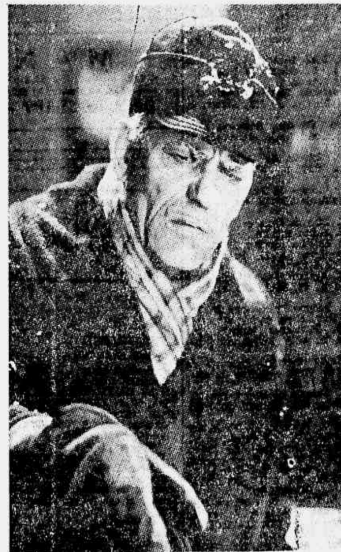
Lon Chaney, na caracterização em que o veremos no film sonoro "Metro-Goldwyn-Mayer", que o Gloria estreia amanhã: "Trovão"

de um velho machinista, que em dez episódios todos, pela arte perfeita de Lon Chaney, fazem de "Trovão", um dos mais humanos films de ultimamente, para o que concorre, em verdade, o desempenho de Phyllis Haver, que tem, neste film, o seu ultimo trabalho, porquanto recentemente consorciou-se com um millionario nova-yorkino e James Murray, Fran Morris e George Duryea, o galã de René Adorée em "Ouro Re-