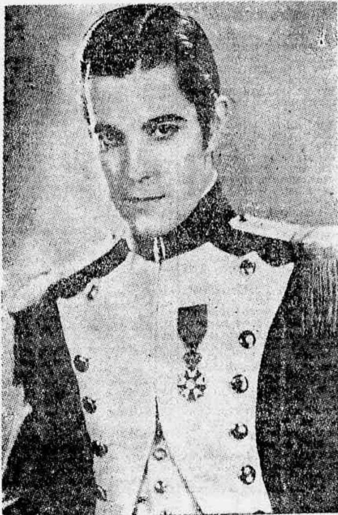
Ramon Novarro canta e luta pelo amor e pela liberdade, vibrando em "O Bem-Amado", o romance canção "Metro-Goldwyn-Mayer", que o Rio verá e ouvirá no Palácio, daqui a dias.

heróis, que marcham, cantando, em fusão com a sua figura; os instantes sentimentais, em que tanto lhe vem Dorothy Jordan, como Ramon Novarro e ainda Marion Harris, cujo modo de cantar "If he cared" (uma das canções do filme) entenece; os momentos alegres, em que tanto há a expressão de Novarro, como de John Miljan e de episódios em que o humorismo toma lugar do romantismo que envolve quase que todo o filme; o colorido, o lindo processo "technicolor" grifado em beleza os momentos que reconstituem um festival campestre em Grenoble, e onde, aliás,