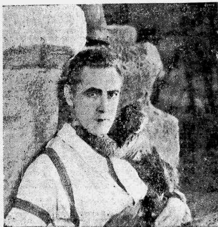
John Barrymore, no "General Crack"

JOHN BARRYMORE E O QUE O GRANDE ARTISTA PENSA DO SEU MAIOR 'FILM': "GENERAL CRACK"