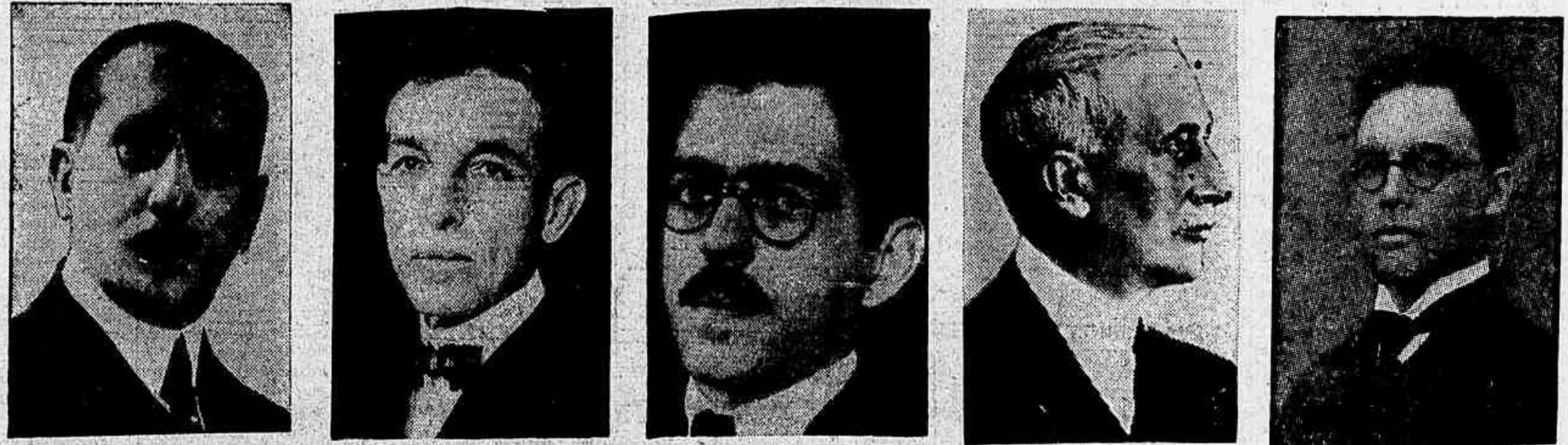
OS SRS. ARTHUR BERNARDES, AFRANIO DE MELLO FRANCO, E FRANCISCO DE CAMPOS, EM CUJAS MAOS DEVIA ESTAR O GOVERNO DE MINAS, E OS SRS. ANTONIO CARLOS E ODILON BRAGA, QUE MAL CORRESPONDEM A'S EXPECTATIVAS E ESPERANÇAS DO POVO MINEIRO