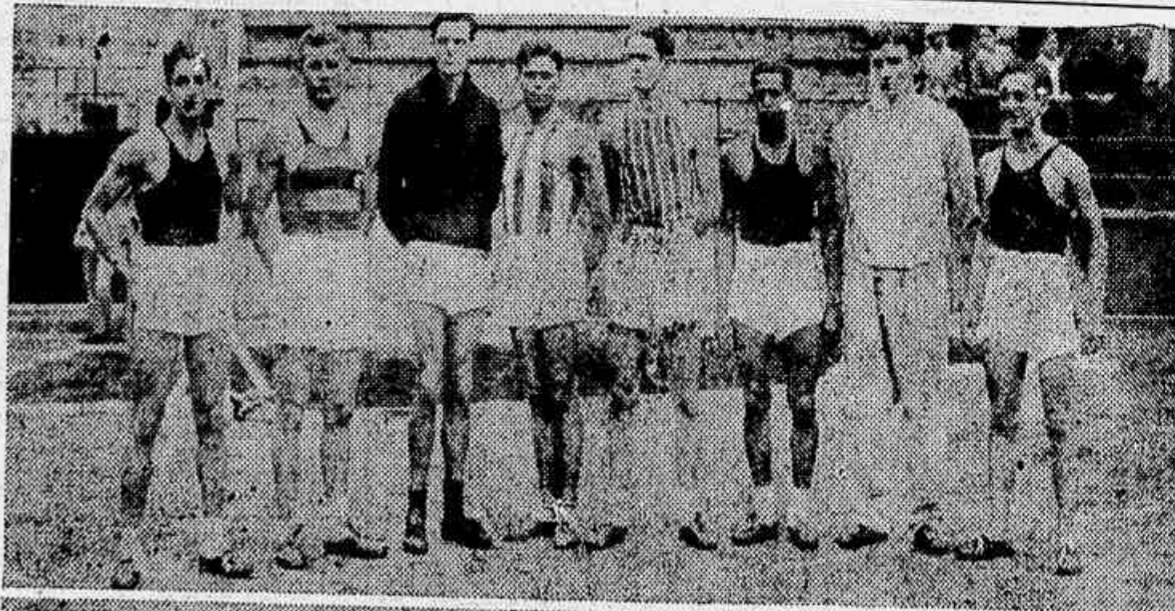
Grupo de atletas que disputaram a ultima competição e, novamente, irão competir no proximo domingo