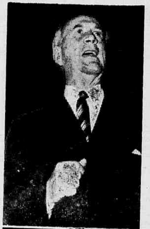
O Sr. Oswaldo Aranha quando pronunciava a sua comovida oração.