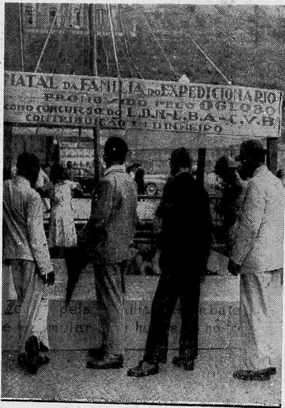
No Largo da Carioca, o povo deixa na "pirâmide" uma contribuição para o Natal da Familia do Expedicionario, promovido pelo O GLOBO, com a cooperação da Cruz Vermelha Brasileira, da Liga da Defesa Nacional e da Legião Brasileira de Assistencia.

clonario teve como finalidade principal a mobilização psicológica da população carioca. Foi levada a efeito em apenas vinte dias. Barracas armadas pela L. D. N. recolhiam donativos, desde a mais insignificante moeda, afim de que todos participassem no que se convencionou chamar "campanha relâmpago". Comissões especiais de senhoras e senhoritas percorreram as principais firmas comerciais Grupos de trabalhadores de diversas profissões realizaram coletas. O mesmo levaram a efeito moradores de diferentes bairros. Tudo isso sem a preocupação de angariar grandes somas, porque o que se objetivava acima de tudo, era a mais ampla e espontânea participação do povo, sem maiores sacrificios. Assim, houve listas que reuniram milhares de cruzeiros, e outras que não ultrapassaram quatro ou cinco dezenas. Umas como as outras exprimiam o mesmo sentimento fraternal e o mesmo interesse carinhoso para com os lares que deram um combatente ao Brasil.