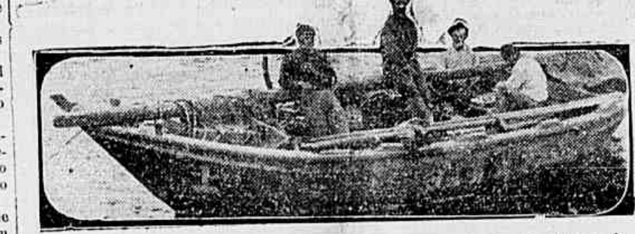
Os pescadores. O projecto Pio Dutra, longe de beneficiar os esforçados homens do mar, levá-os á todos, incoraavelmente, no "arrastado"...

O nosso legislativo municipal a quem accusamos de cuidar de tudo menos dos interesses dos municipes, mostra-se agora empenhado em modificar o modo porque é feito entre nós o commercio de peixe, com o fim