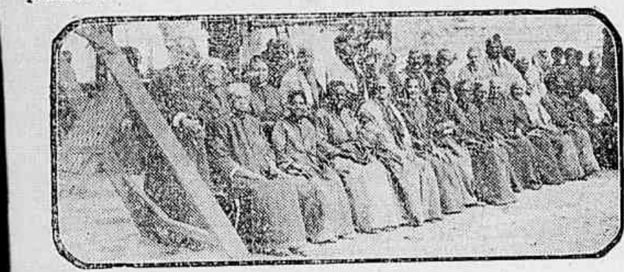
Os velhos: cabellos brancos, pelle enrugada, desfolham no inverno as ultimas illuções da primavera

Asylo S. Francisco de Assis, Asylo da Velhice Desamparada, Casa dos Expostos, Casa de S. José, Escola de Menores Abandonados, Escola Preenhitoria 15 de Novembro, Escola Profissional e Asylo para Adultos, Instituto de Protecção João Alfredo, Instituto de Protecção Orsina da Fonseca, Instituto de Protecção Souza Aguiar, Orphanato Evangelico, Orphanato Ozorio, Orphanato de Santo Antonio, Orphanato de Santo Antonio (de Marangá),