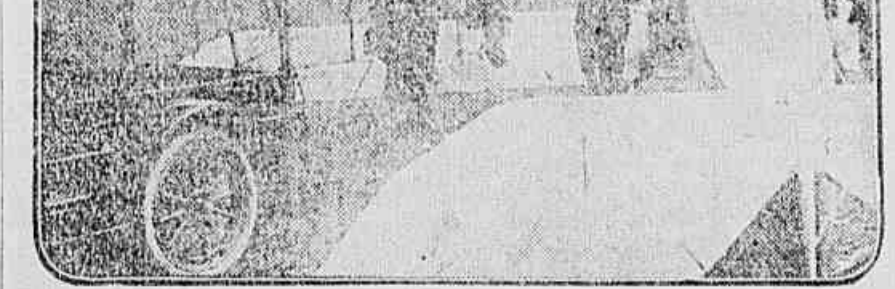
A navegação commercial aerea nos Estados Unidos. Nella será moldada a uruguaia brasileira?

Tanto em Montevideo, como no Rio, já se começa a fazer a navegação.