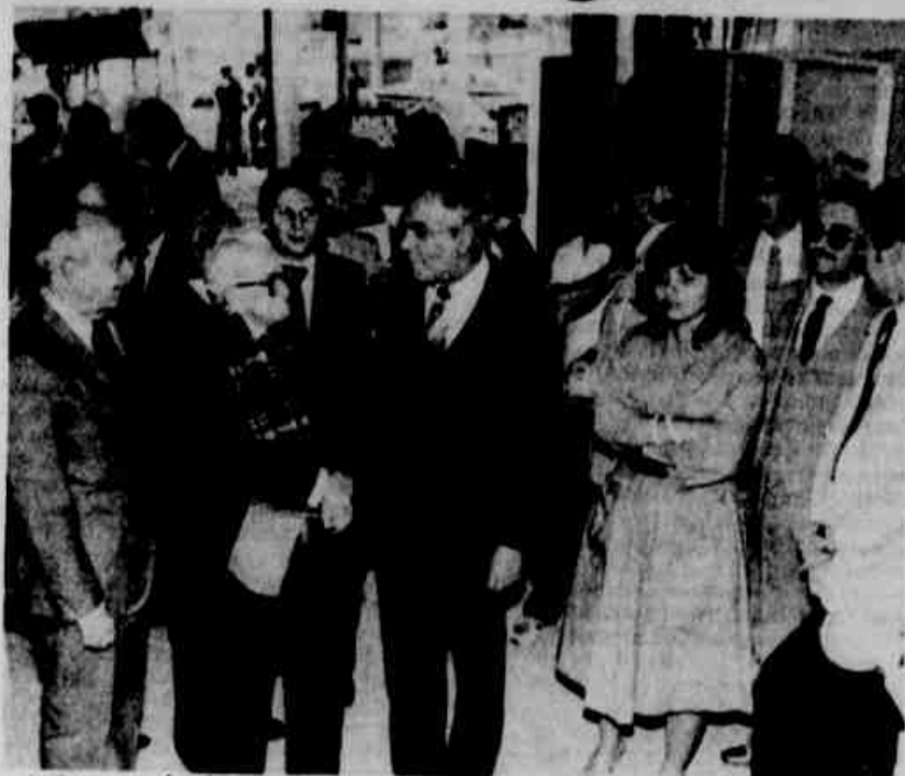
* O governador José Richa recebeu o professor Sobral Pinto.