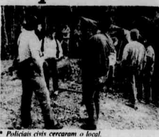
Policiais civis cercaram o local.