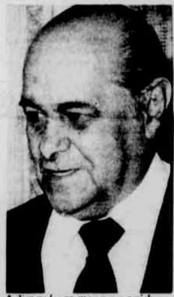
* Tancredo, promessa aos gaúchos.

Porto Alegre (AE-CN) - O candidato da Aliança Democrática, Tancredo Neves, comprometeu-se ontem, em Porto Alegre, ao falar no ato de protesto "O grito do Campo", a incluir em seu programa de governo o "Combate à política recessiva, reforma do atual modelo econômico, que é injusto ao ponto de vista social, participação real do povo nas decisões políticas, como é próprio dos sistemas democráticos, retomada imediata do desenvolvimento econômico e de progresso social".