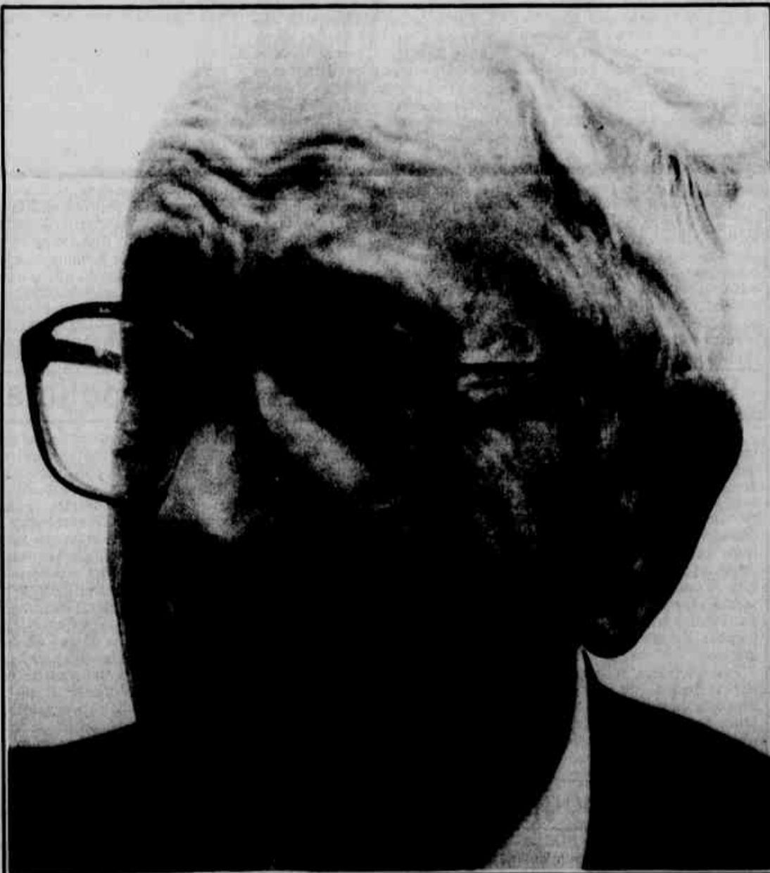
* Sobral Pinto: "É indispensável uma mudança. Mudança em 15 de janeiro".

O ecologista José Lutzemberg adverte para o que chama de "conspiração diabólica": as multinacionais primeiro fazem os agrotóxicos e, depois, os remédios. Ele aponta três saídas para a salvação. Pág. 3.