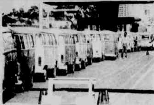
* Pela aduana, lado brasileiro, passa uma média de 15 carros roubados por semana.

Outra coisa: em todo o Brasil são praticados roubos de carros de todas as marcas e anos de fabricação, com maior incidência para os novos, fato que até pouco tempo era praticado muito esporadicamente nas cidades fronteiriças com o Paraguai, no entanto, nos últimos meses vem se constatando vários furtos de carros velhos, principalmente de linhas ainda em circulação, os quais, segundo um proprietário de oficina mecânica em Foz do Iguaçu, são levados para o