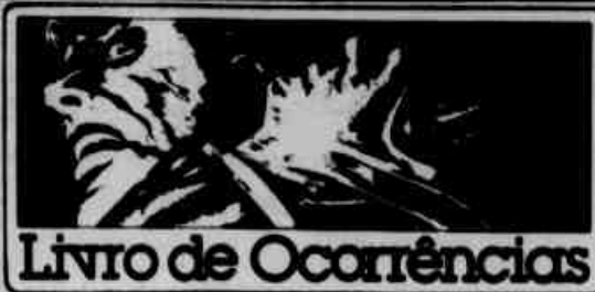
Livro de Ocorrências