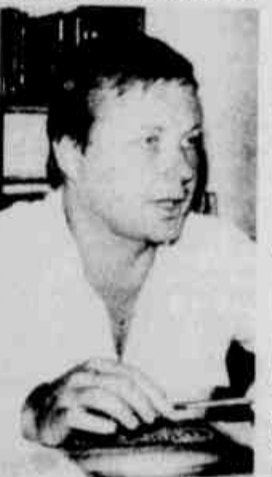
Demeterco: uma solução.

Dentro de um supermercado não temos vendedores para sugestio-