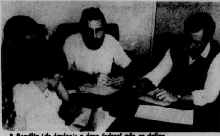
* Bendlin (de óculos): a área federal não se define.

cretaria de Saúde está retirando do mercado os seguintes produtos: Energisan 5000 injetável; Argiplex, Energiplus, Frutolan, Viner, Energisan EV, Energina, Energiful, Enertrim, Energotress, Neo Magno Sedans, Biosstar Injetável, Sol Injetável de Dintrila Succinica com Vitamina B12, Fructomax, Elovix Injetável e Energisan 5000, Succil B12, Vista Nitril 1000 e Vita Succina.