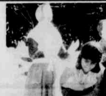
* Uma das três réplicas da imagem da santa.