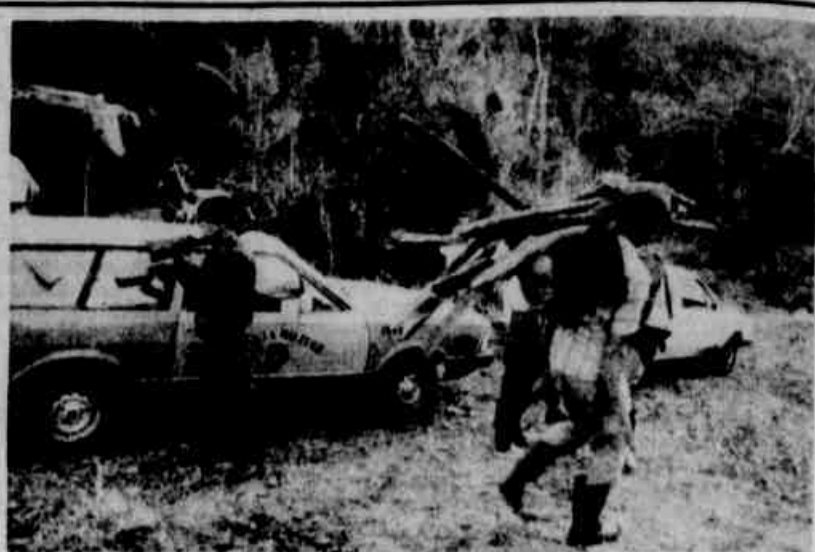
A polícia tomou o acampamento de surpresa.