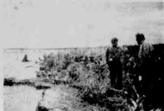
* Policial mostrando que as ondas do lago formam uma espécie de rampa natural, as quais são usadas pelos laranjais para colocar o carro nas lanchas.

Paraguai pela própria Ponte da Amizade - afinal, carro velho não chama a atenção - e lá desmontados e as peças revendidas naquele país e aqui, em oficinas mecânicas tocadas por picaretas.