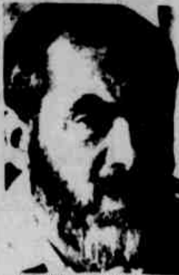
Rabino Meir Kahane.

Televivo (UPI-CN) - Inabalável em sua campanha para expulsar os árabes de Israel, o Rabino Meir Kahane já esteve, desde sua eleição para o Parlamento israelense há dez semanas, no velho mercado árabe de Jerusalém (onde seus seguidores mexeram e derrubaram objetos expostos); foi detido às portas da maior cidade árabe de Israel, Umm El-Fahm (onde pretendia convencer os moradores da legitimidade de suas ideias); embarcou para os Estados Unidos para levantar fundos para sua cruzada; e ontem perambulou por um campo de refúgio de árabes de Dahaihshe, ao sul de Belém acompanhado por quatro adeptos vestindo camisas ilustradas com um punho erguendo-se da Estrela de Davi. A seguir, Kahane pretende ir a Cisjordânia ocupada, no próximo dia nove para convencer as judias casadas com palestinos a abandonarem seus maridos.