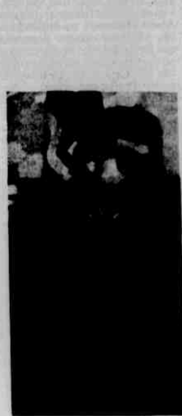
Ortega: plano está preparado.

Isto foi uma referência a Paul Scoon, o governador geral de Granada, que foi elevado ao cargo de chefe de Estado de Granada depois da invasão encabeçada pelos Estados Unidos da ilha antilhana, em outubro último. O dirigente nicaraguense fardado, que advertiu o mundo antes sobre o que ele descreveu como uma invasão iminente de seu país, pintou um cenário de "atores em seus lugares indicados, com papéis decorados" para o ataque norte-americano.