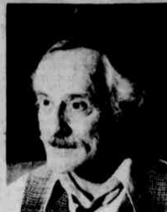
* Paulo Autran no programa "Hebe".