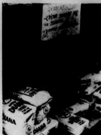
* Açúcar agora é racionado.