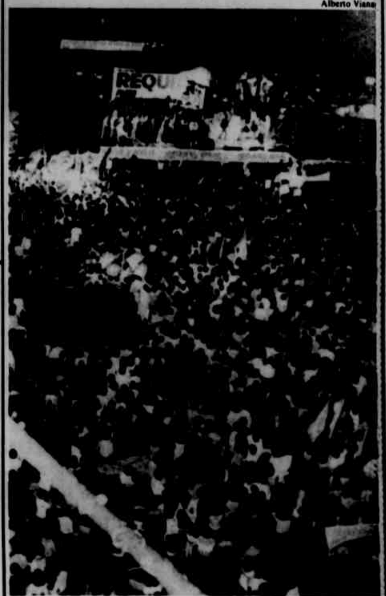
O comício promovido pelo PMDB na Boca Maldita, na noite de segunda-feira, foi o maior da atual campanha para prefeitos das capitais do País. Página 2.

Paraguai fecha fronteira para prender ladrões