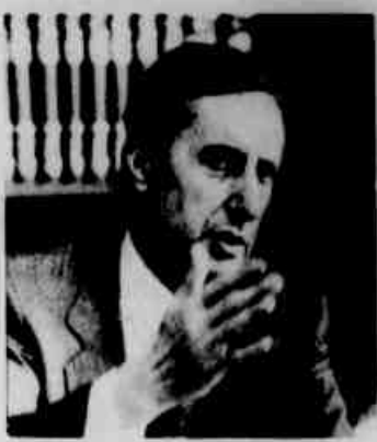
* Funaro: vou soltar o Leão.

O ministro da Fazenda, Dilson Funaro, reafirmou ontem, durante almoço em sua homenagem oferecido pela Confederação Nacional da Indústria, que o aumento de impostos será a última medida que o governo adotará para reduzir seu déficit público e que não será superior ao intervalo entre 10 e 12% da receita tributária prevista para o próximo ano. Se isto realmente se confirmar, a arrecadação da União em 1986 subirá dos Cr$ 305 trilhões previstos para algo entre Cr$ 335 e Cr$ 340 trilhões.