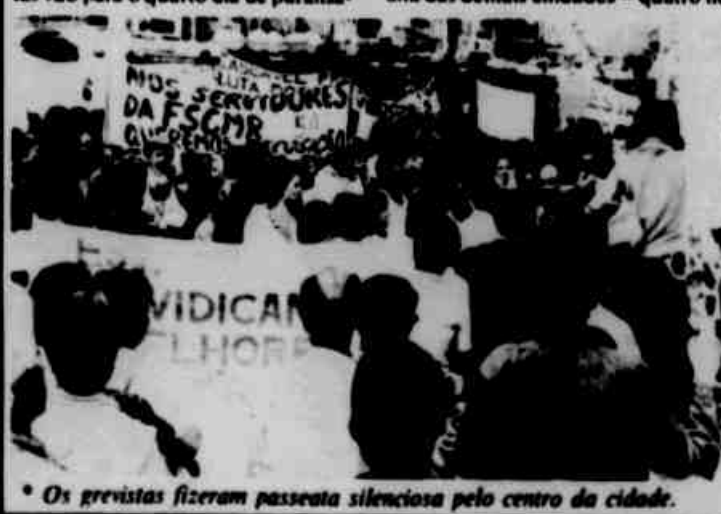
* Os grevistas fizeram passeata silenciosa pelo centro da cidade.

Quando ao problema específico dos funcionários de Saúde, "eles não poderão alimentar por muito tempo a posição que privilegiamos categorias. O próprio aumento da pauta de reivindicações é um reconhecimento disso (antes da greve os servidores exigiam apenas reposição de 50% nas negociações, depois ampliaram os pedidos para 15 itens). Mais da metade da massa dos funcionários teve muitas melhorias na atual gestão, e ela sabe disso".