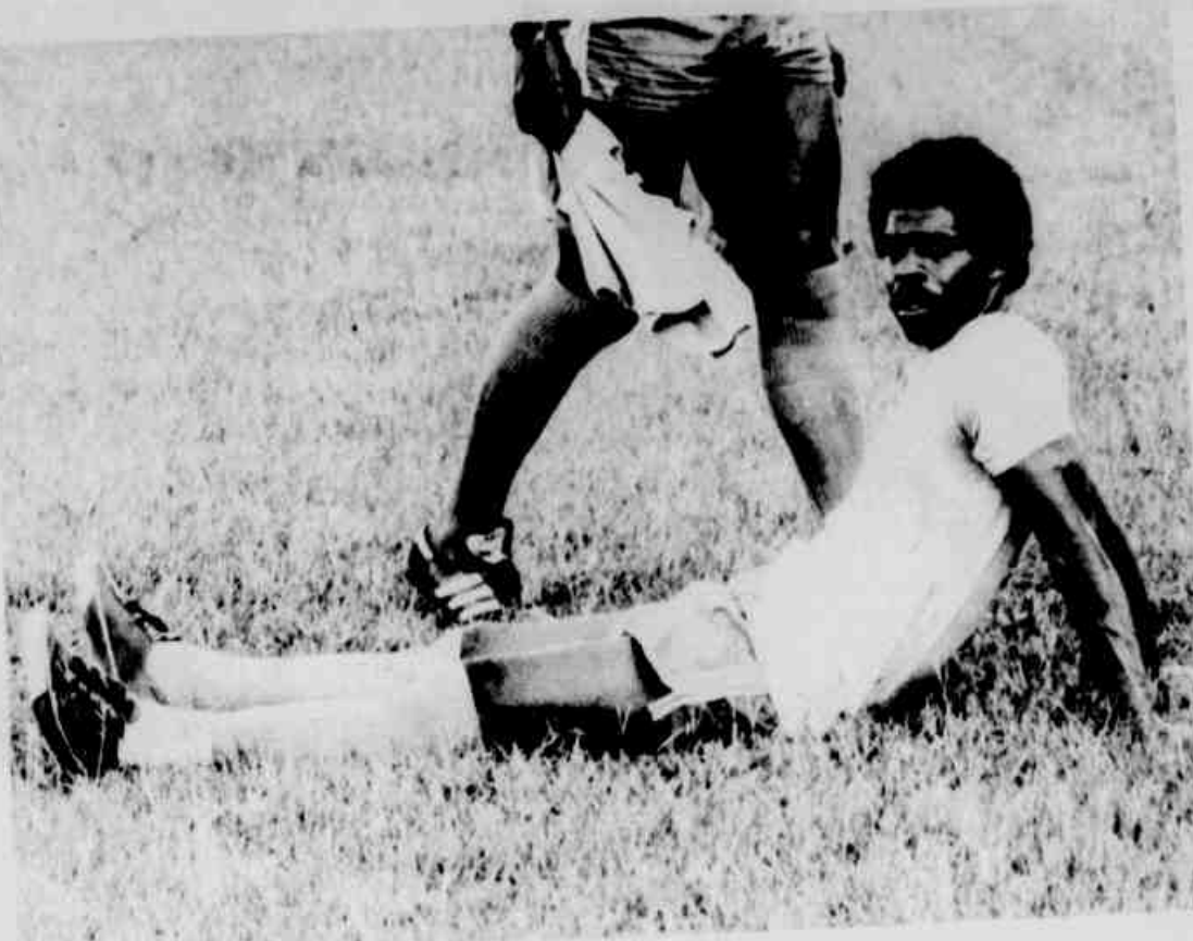
* Sotter não joga sábado.