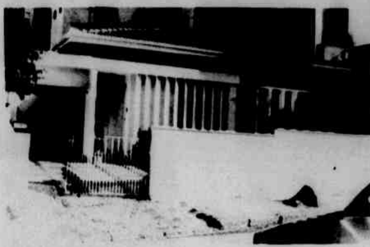
* Residência da Padre Anchieta. Prejuízo: Cr$ 200 milhões.

Em dois assaltos mais de 250 milhões de cruzeiros em jóias e aparelhos eletrônicos foram roubados. O primeiro assalto ocorreu às 20 horas de segunda-feira, na rua Padre Anchieta, 1.137, residência da cunhada do deputado Nelson Buffara, Delurdes Buffara. Dois homens, um loiro, trajando roupa escura e boné preto e outro baixo, trajando roupas claras, ambos aparentando 30 anos, aguardaram Delurdes deixar sua residência e em seguida entraram e dominaram a empregada da casa. Estavam com revólveres de grosso calibre e fugiram a pé levando cerca de 200 milhões em jóias. Possivelmente os mesmos ladrões, que na manhã de ontem, às 10h15min, invadiram a mansão do industrial Carlos Pastre, situada na rua Fernando Moreira, 868, centro.