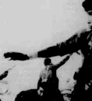
* Milicianos pró-sírios combatem forças de muçulmanos fundamentalistas em Trípoli.