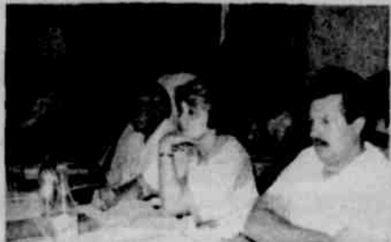
* A mesa que dirigiu o encontro.