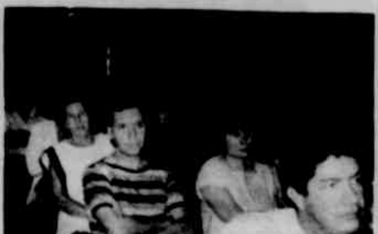
* Professores assistiram a reunião e debates.