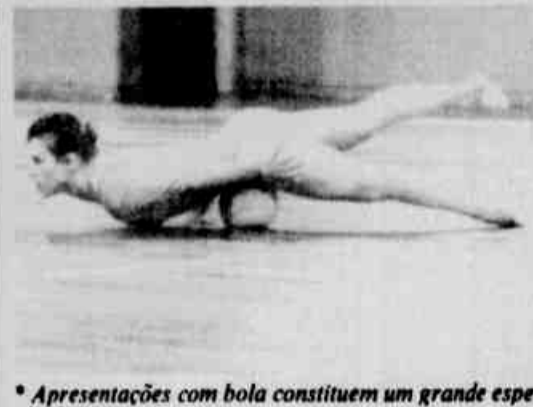
* Apresentações com bola constituem um grande espetáculo.