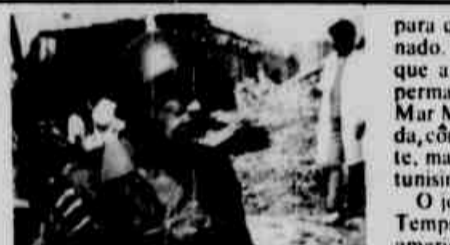
Guardas em frente do que sobrou da sede da OLP em Tunis.

para que o bombardeio seja condenado. Fontes do governo disseram que a Sexta Frota norte-americana permanentemente posicionada no Mar Mediterrâneo, estava sem dúvida, cônica do ataque aéreo iminente, mas não informou às autoridades tunisinas. O jornal diário independente "Le Temps" disse que o silêncio norte-americano era "uma punhalada nas costas", enquanto que o jornal "Al Sahba" disse que Washington "não estava sozinho. Onde estavam os franceses e seus monitores, os italianos e seus radares?". Uma declaração formal na qual a administração Reagan descreveu a incursão como "resposta legítima a um ato de autodefesa" somou-se às dúvidas tunisinas sobre as intenções norte-americanas, disseram as fontes. O ministro das Relações Exteriores de Israel, Yitzhak Shamir, entrevistado pela rádio de Israel desde Nova York, onde ele está assistindo a sessão da Assembleia Geral das Nações Unidas, disse que a maioria dos países aprovou o ataque e que não "haveria um preço político a ser pago".