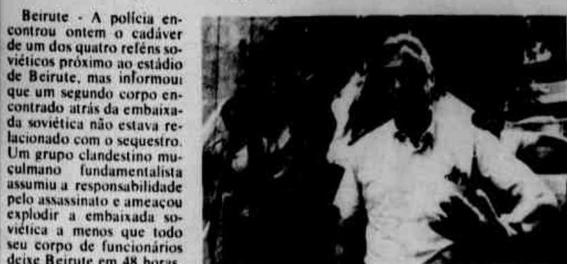
Funcionário da embaixada russa chega para identificar cadáver do adido comercial.

O cadáver de um dos soviéticos seqüestrados no Líbano foi encontrado ontem em Beirute, enquanto um grupo muçulmano ameaça explodir a embaixada russa.