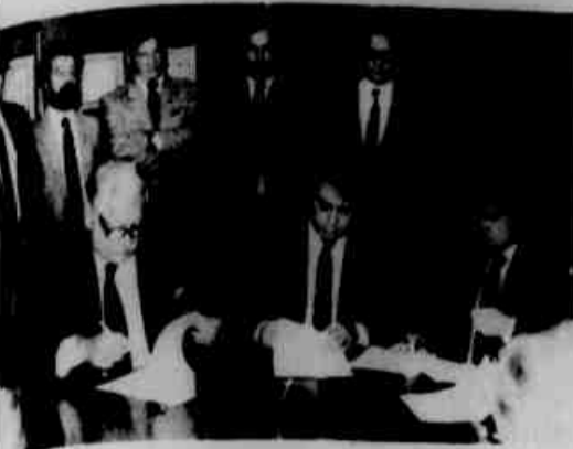
Solenidade de assinatura do compromisso.