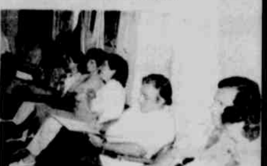
* Autoridades regionais.