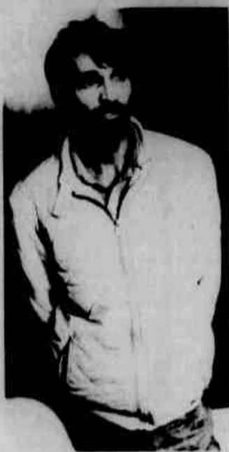
* Palito: "Acusações levianas".

Afirmou, em tom ríspido, que os comentários em torno dele são infundados. Repetiu em diversas ocasiões que jamais participou de quadrilhas e de outras mortes, além do homicídio contra o PM, na época em que "Palito" era policial militar. Perguntas realizadas por jornalistas de diferentes órgãos de comunicação recebiam as mesmas respostas, ficou evidente que o pistoleiro havia sido bem orientado pelos seus advogados.