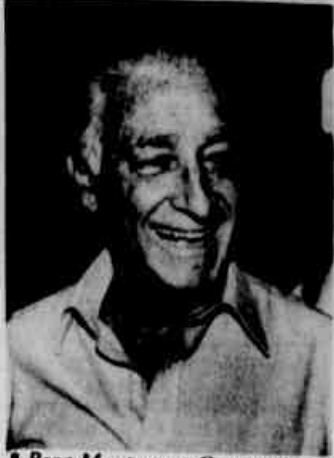
Para Montoro, a Constituinte deve decidir essa questão.

A reeleição do presidente da República e dos governadores de Estado deve ser discutida e votada pela Assembleia Nacional Constituinte, não devendo assim ser válida para os atuais governantes. Essa afirmação foi feita ontem, no Palácio dos Bandeirantes, pelo governador Franco Montoro, ao defender essa posição, mencionando o exemplo dos Estados Unidos, onde a população é consultada depois de quatro anos de mandato de um presidente e decide se deseja a continuidade do governo ou não. No entanto, Montoro deixou claro que a reeleição só deve atingir os próximos governantes.