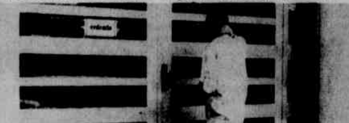
Como Solange, poucos chegaram fora da hora.

Três mil e duzentos já desistiram do vestibular da Federal, considerado até agora fácil pelos estudantes. Hoje, porém, a parte mais dura: tem provas de Matemática e Física. E o número de desistências deverá subir. As provas de domingo e de ontem, com seus gabaritos, estão na página 16. Já na página oito, você vai encontrar tudo sobre o vestibular da Federal e as provas de hoje do Cefet.