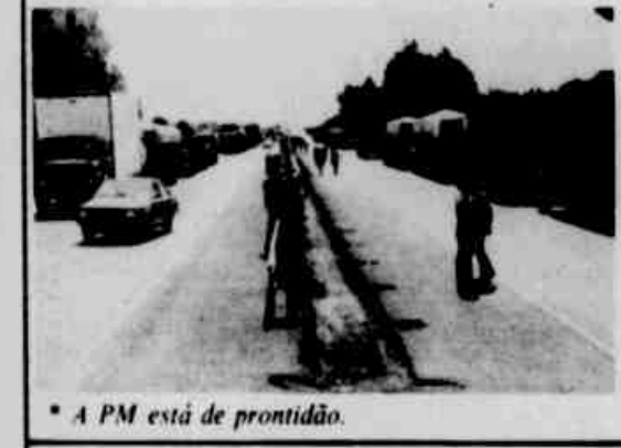
* A PM está de prontidão.