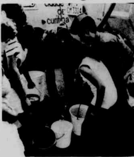
* Bombeiros socorrem Jardim Monte Verde.

Formando uma fila diária com quase 400 pessoas, os moradores do conjunto reclamavam por faltar água na região afirmando não entender por que em bairros centrais o problema não havia sido registrado. Exaltados quase agrediram os funcionários ao receberem água suja de um caminhão. Substituindo o caminhão por outro a