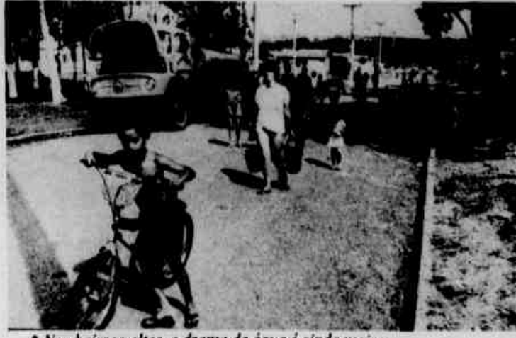
* Nos bairros altos, o drama da água é ainda maior.

Richa afirmou ontem que a situação de emergência não significa ainda calamidade pública.