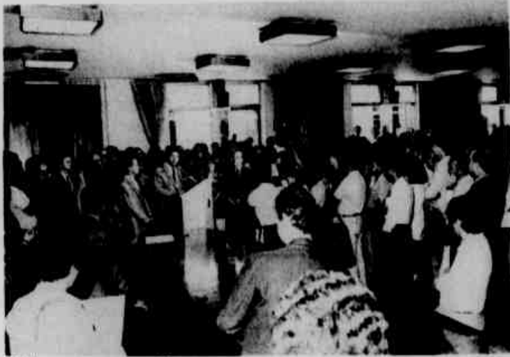
• Uma posse concorrida.