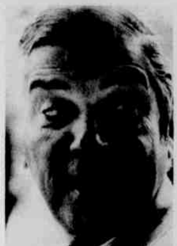
* Canet: apoio a Deni.

Canet cumpre à risca: silencioso e reservado quando em Curitiba, no interior fala do que pensa sobre o momento político paranaense.