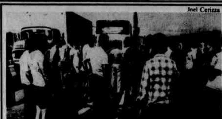
Caminhões parados na estrada, falta de comida na mesa do brasileiro. É a greve dos carreteiros que na BR-116 fez uma fila de 8 quilômetros, e ameaça o mercado com um colapso no abastecimento. Pág. 8.

Três mil e duzentos já desistiram do vestibular da Federal, considerado até agora fácil pelos estudantes. Hoje, porém, a parte mais dura: tem provas de Matemática e Física. E o número de desistências deverá subir. As provas de domingo e de ontem, com seus gabaritos, estão na página 16. Já na página oito, você vai encontrar tudo sobre o vestibular da Federal e as provas de hoje do Cefet.