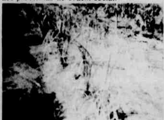
* Outra cultura que está se perdendo no Noroeste é o arroz.