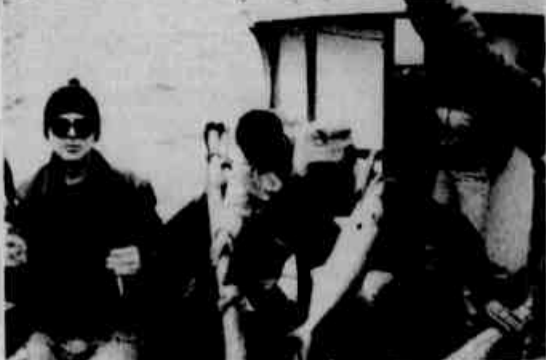
Os iates de todo o Brasil deverão participar.

Lançado pelo late Clube de Caiobá visando o conagração dos iates clubes de todo o País, será realizado no próximo dia 17, o 1º Concurso Aberto de Pesca de Fundeio. Da entrada da Barra às nascentes da Baía de Guaratuba, dezenas de duplas estarão empenhadas na pesca dos mais variados tipos de peixes, cuja premiação, além dos troféus e medalhas conferidas aos 10 primeiros colocados, será efetivada com o Troféu Dr. Hermes Macedo, de caráter transitório, à representação do late Clube vencedor. Somente após três vitórias consecutivas ou cinco alternadas, o late Clube detentor destas conquistas, ficará com o troféu em definitivo.