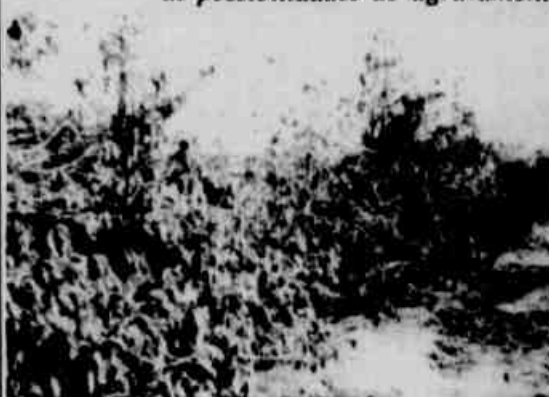
* Os cafezais terão quebra de 30% na safra.