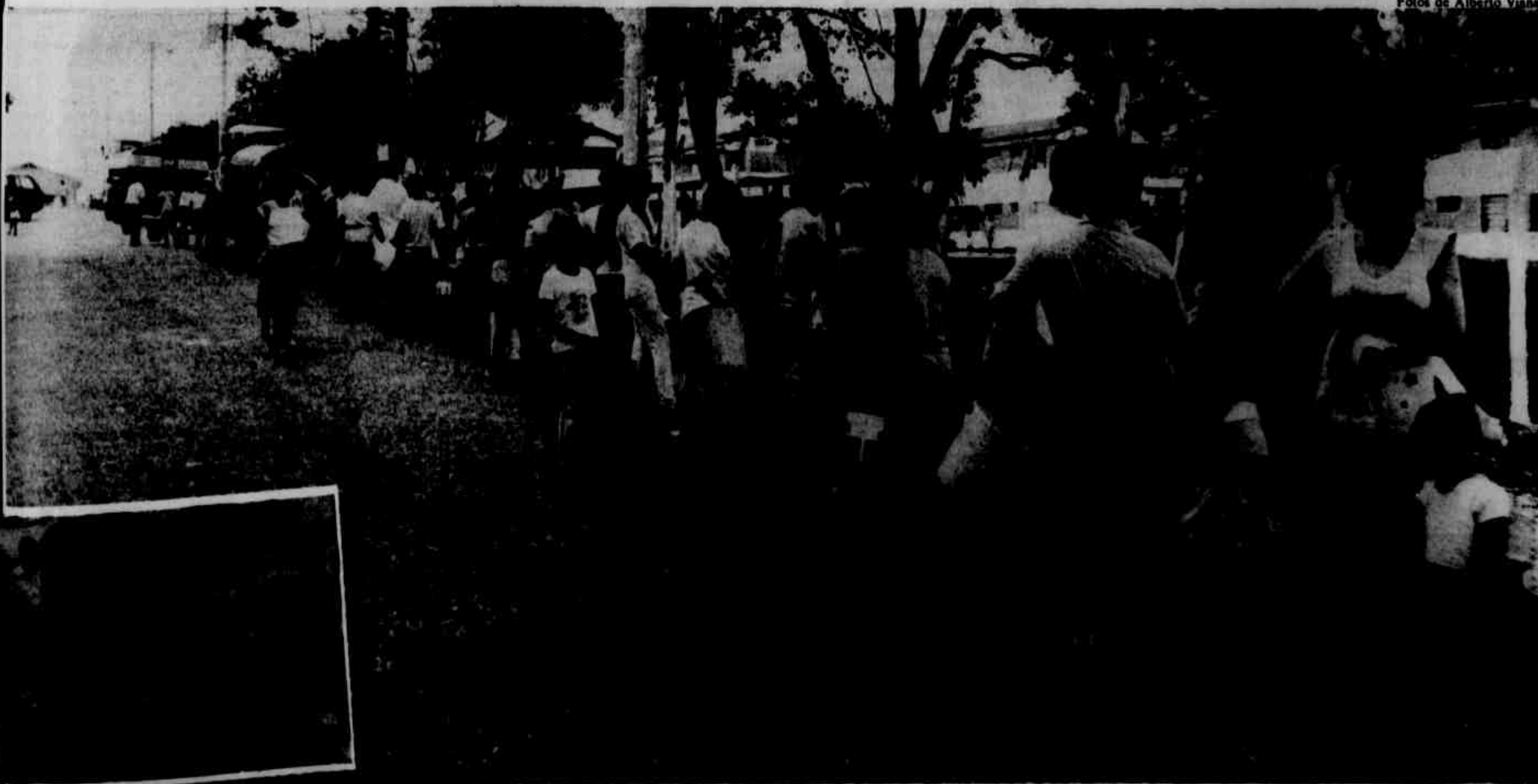
Há onze dias sem água, as setecentas famílias do Conjunto Monte Verde enfrentaram ontem longas filas para conseguir um balde cheio. Houve, inclusive, princípio de tumulto, com a intervenção da PME.

O acordo de paz no Líbano pode explodir em guerra. Os norte-americanos pedem atenção, "para responder às ações terroristas de Kadafí", segundo a Casa Branca. Pág. 11.