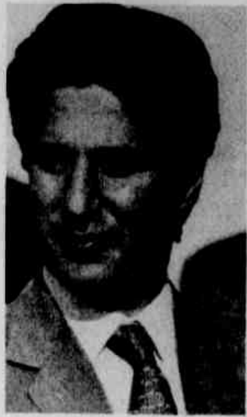
O próprio presidente Gemayel não concorda com o acordo.

Segundo o jornal esquerdista "As Saifir", Gemayel, embora não explicita sua posição, já se colocou abertamente contra o acordo de paz proposto pela Síria.