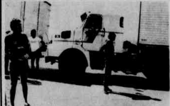
* O movimento é pacífico.