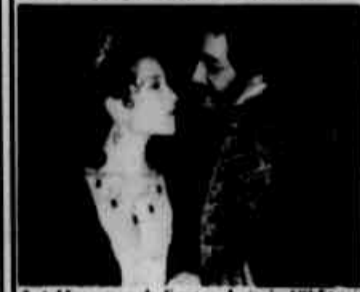
A Marquesa de Santos, hoje às 18h55min, na Manchete.

As Aventuras de Haji Baba. Uma produção de 1954 dirigida por Don Weis e que tem em seu elenco os nomes de John Derek, Elaine Stewart, Rosemarie Bowe e Thomas Gomez.