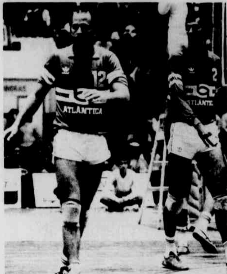
A Bradesco Atlântica não está na chave do Cristalino.

"Foi excelente. O que a gente perdeu em ritmo neste período a gente ganhou em vontade de jogar, espiritualmente, intelectualmente. A cabeça tá fresca e aí fica fácil recuperar o ritmo de