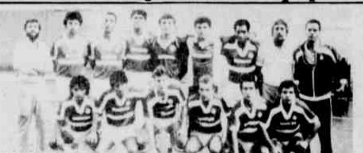
O Candeias ficou em primeiro no grupo "A".