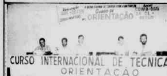
As autoridades prestigiaram o evento.

O curso internacional de técnicas de orientação, ministrado quarta-feira, durante todo o dia, pelo ex-campeão mundial da modalidade, o sueco Goran Ohlund, reuniu um expressivo número de adeptos deste esporte e foi por isso mesmo considerado como tendo sido perfeitamente válido o esforço da Secretaria de Estado da Cultura e do Estado em promovê-lo, já que no Paraná é bastante significativa a quantidade de adeptos do cross country.