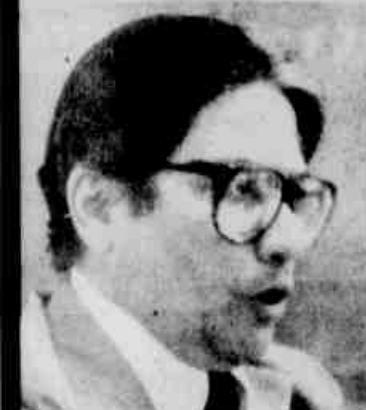
O ex-senador Francisco Leite Chaves, do Paraná, foi nomeado, ontem, Procurador Geral da Justiça Militar pelo presidente José Sarney.