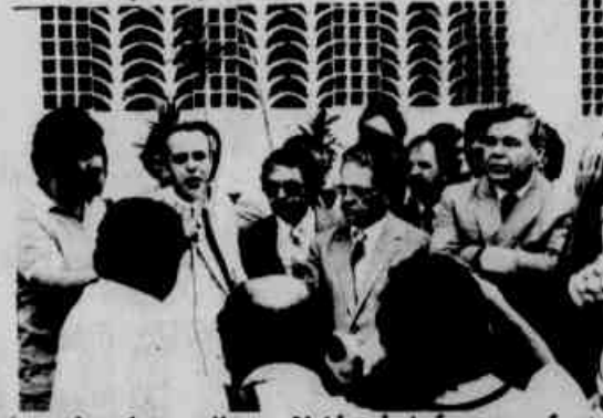
... adversários políticos. Unidos, hoje formam a frente...