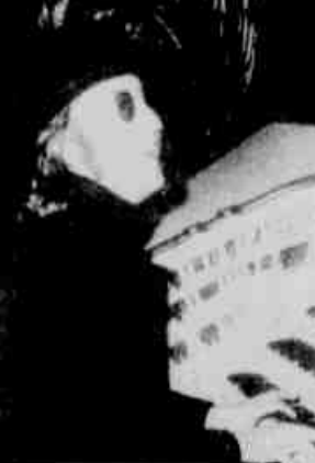
* John Lennon Especial, hoje a partir das 14h25min na Globo.