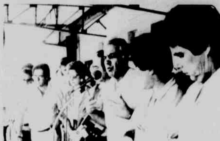
* Richa: "Dobrar a atual produção de 50 milhões de toneladas".

"Temos a esperança de fortalecer o nosso sistema de produção agrícola e pecuário do País, a partir das medidas econômicas adotadas corajosamente pelo presidente José Sarney". A afirmação foi feita ontem, em Londrina, pelo governador José Richa, na abertura da 26ª Exposição Agropecuária e Industrial, na presença do ministro interno da Agricultura, senador Lázaro Barbosa, e de outras autoridades. Defendeu uma reforma estrutural na pasta da produção, afirmando que chegou o grande momento de se estabelecer no País uma nova e definitiva política para o setor agropecuario.