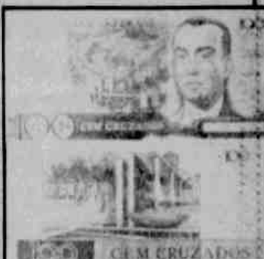
A nota de 100 cruzados, que circula em outubro, terá a mesma estampa da atual de 100 mil cruzeiros. A nota de Cz$ 500 terá a figura de Villa-Lobos. Página 6.