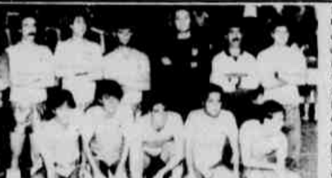
Círculo fica em segundo no grupo "B".

O Futebol de Salão do Círculo Militar que obteve a classificação para as semifinais do Torneio Trinta Anos da Federação, ao vencer a equipe do Seguradora Vera Cruz, pelo placar de 10 a 1, na última quinta-feira, fará no próximo domingo, uma partida amistosa contra o time do Banespa, de São Paulo, como parte dos preparativos para a Copa Brasil de Clubes Campeões, que será realizada entre os dias 27 de abril a 3 de maio, em Curitiba.