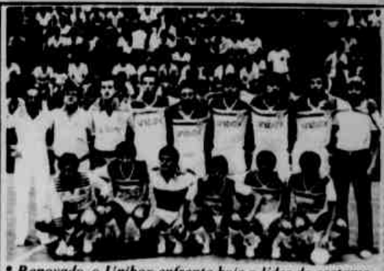
* Renovado, o Unibox enfrenta hoje o líder do certame.

Para realizar serviços de melhorias na rede de distribuição e garantir a segurança dos que executarão os trabalhos e ao público em geral, torna-se necessário interromper o fornecimento de energia elétrica nos seguintes municípios: DIA 14/06/86 - SÁBADO COLOMBO DAS 09.50 ÀS 12.00 HORAS TRECHO: Estrada do Prado (da Rua Francisco Amaro até o final da linha de alta tensão). ALMIRANTE TAMANDARÉ DAS 14.00 ÀS 16.30 HORAS TRECHO: Rua Alberto Piekas (da Avenida Anita Garibaldi até o final da linha de alta tensão, abrangendo toda a Colônia Prado) SÃO JOSÉ DOS PINHAIS DAS 15.00 ÀS 16.30 HORAS TRECHO: Rua Germano Scholger (da Avenida Rui Barbosa até a Rua João José Massaneiro). DIA 15/06/86 - DOMINGO CAMPO LARGO DAS 08.00 ÀS 09.00 HORAS LOCALIDADES: Campo Largo, Itaqui, São Luiz do Puro, Rondinha e Bateias. ARAUCÁRIA DAS 09.50 ÀS 11.00 HORAS TRECHO: Rua Minas Gerais (da Rua Archelau de Almeida Torres até a Rua Duque de Caxias, abrangendo Jardim Gralha Azul, Jardim São Francisco, Jardim Beira Rio, Jardim Magnópolis e Jardim Santa Helena).