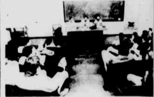
* Os jornalistas convidados.

Alunos, profissionais e professores de jornalismo que participaram ontem à noite do debate sobre a questão da extinção do diploma de jornalista para o exercício da profissão - realizado no anfiteatro da área de Humanas da Universidade Federal do Paraná - posicionaram-se todos pela permanência do curso e exigência do diploma. No final, uma decisão: o início da luta para combater qualquer iniciativa que vise o fim do diploma. As manifestações se estenderão até 10 de setembro, dia nacional de luta pela permanência dos cursos de Comunicação Social.