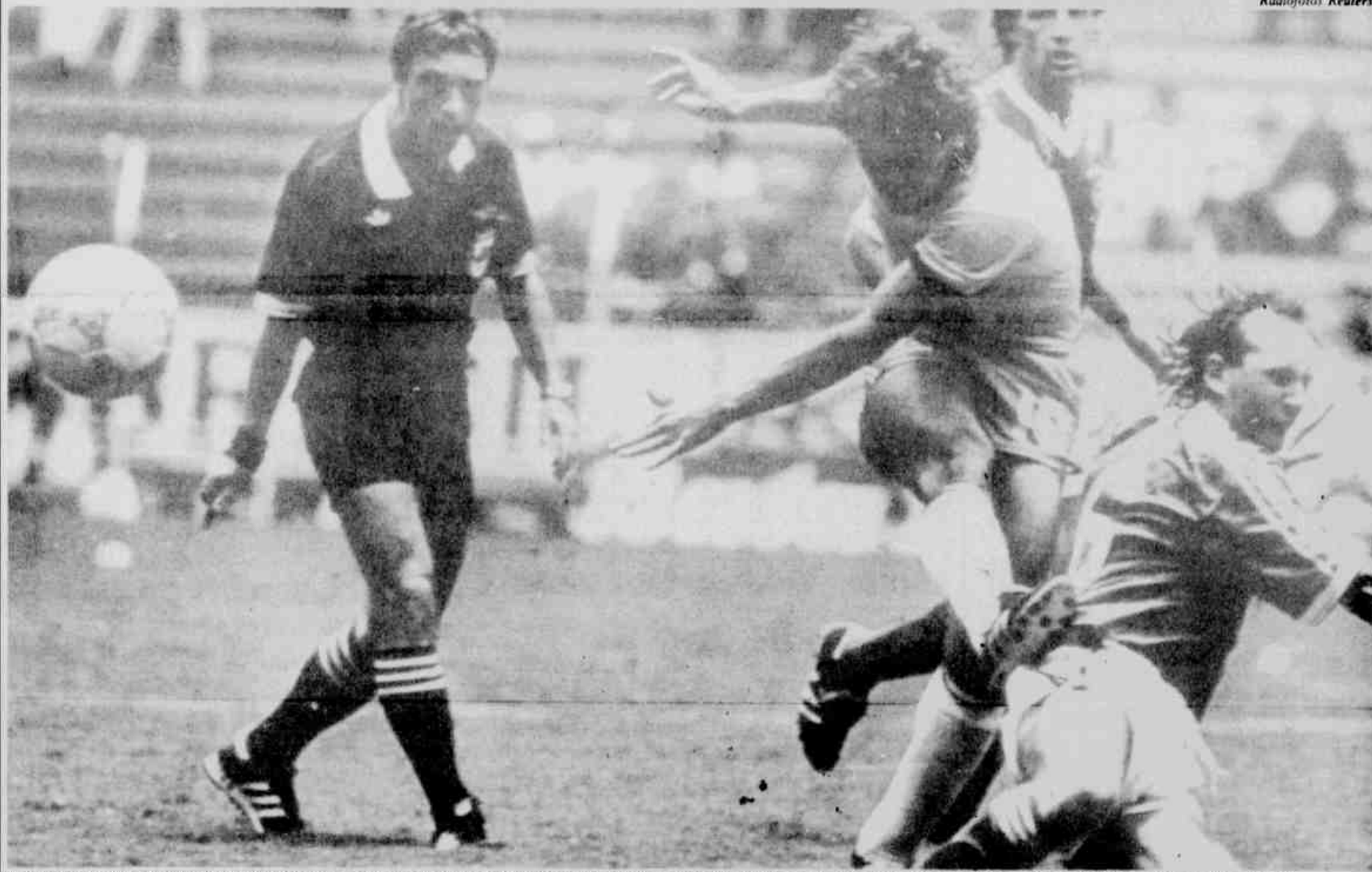
* O bloqueio de David McCreewy impediu que Zico, que entrou no segundo tempo sob os aplausos da torcida, marcasse o seu gol na goleada sobre a Irlanda que sacudiu o Brasil.

Foi a melhor apresentação do Brasil até agora na Copa do Mundo. A goleada de 3 a 0 aplicada sobre a Irlanda do Norte mostrou que a Seleção está no caminho certo e que Telê Santana deixou a teimosia de lado, pois as alterações deram um novo ritmo à equipe. Careca fez dois gols e