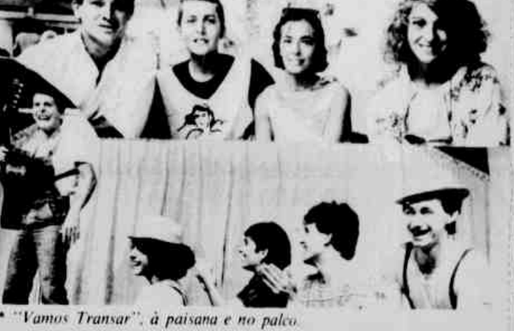
* "Vamos Transar", à paisana e no palco.