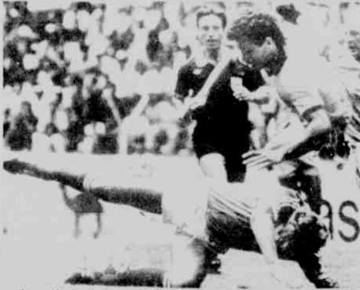
* Careca foi um dos heróis da partida: fez dois gols e não se intimidou diante dos irlandeses.

Foi a melhor apresentação do Brasil até agora na Copa do Mundo. A goleada de 3 a 0 aplicada sobre a Irlanda do Norte mostrou que a Seleção está no caminho certo e que Telê Santana deixou a teimosia de lado, pois as alterações deram um novo ritmo à equipe. Careca fez dois gols e