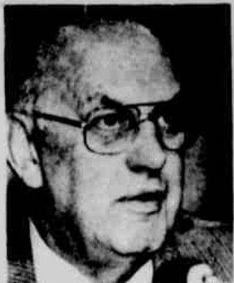
* Pieter Botha tomou a medida.