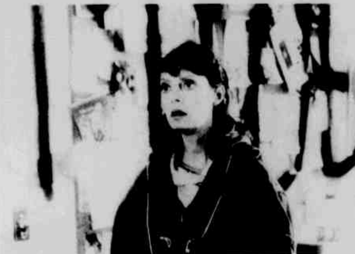
* Susan Sarandon em "Posições Comprometedoras"