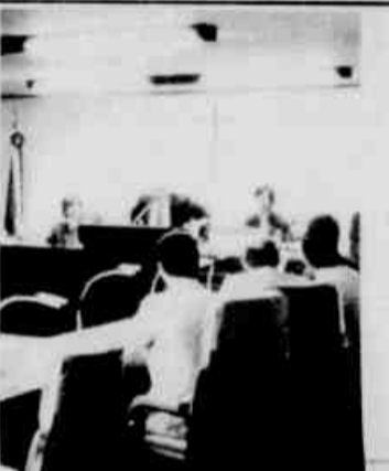
Hoje a decisão do TRT.

A proposta de conciliação do TRT foi de suspensão da greve a partir de