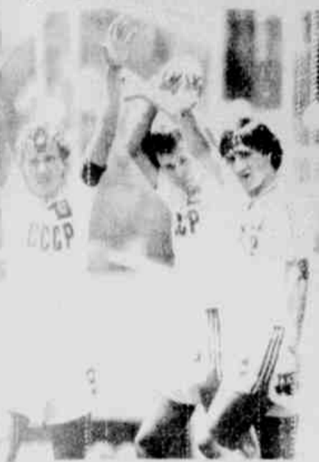
Os jogadores têm rígida disciplina para ganhar.

Disciplina espartana para os jogadores da seleção soviética