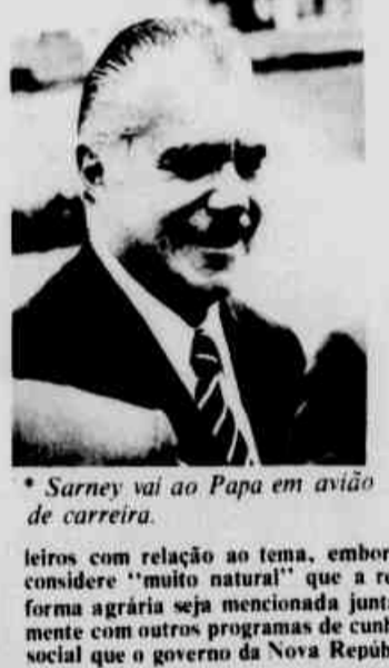
* Sarney vai ao Papa em avião de carreira.

Na sua viagem à cidade do Vaticano, onde será recebido dia 10 pelo papa João Paulo II, o presidente José Sarney deverá usar um avião de carreira, informou ontem o ministro chefe do Gabinete Civil, Marco Maciel, acrescentando que com isso ele ganhará tempo para incluir na agenda uma visita protocolar também ao governo da Itália.