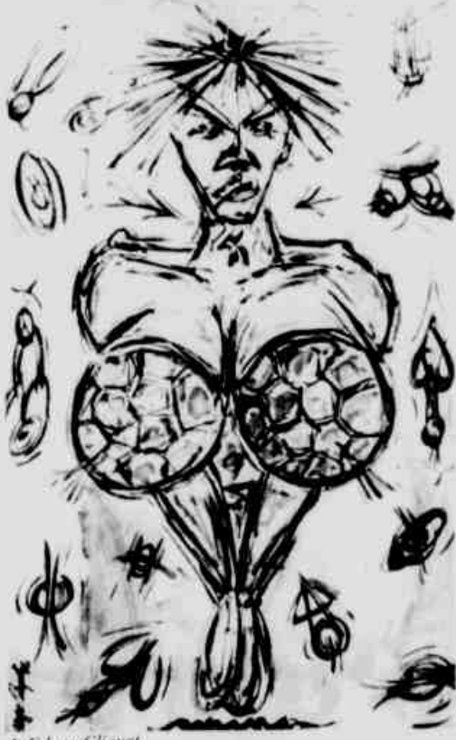
• Edgar Cluquet