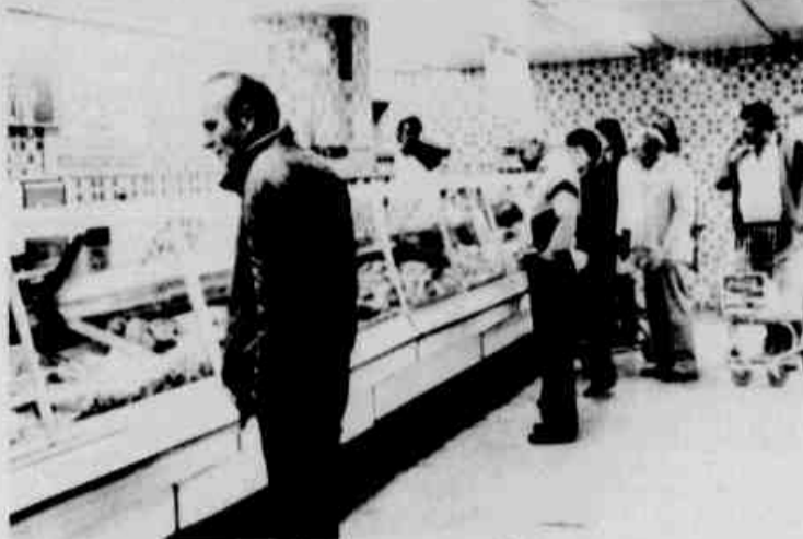
* A carne está terminando nos supermercados.