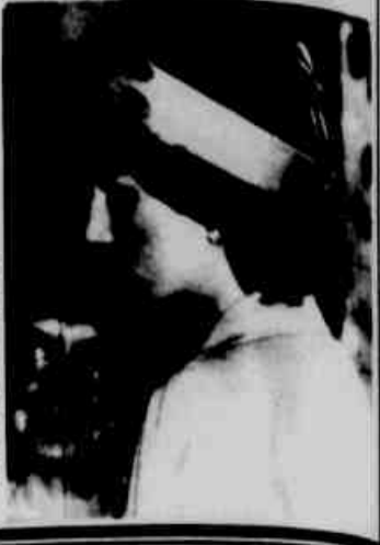
* A princesa Diana usa um chapéu bem exótico durante a cerimônia de inauguração de um hospital que leva seu nome, no País de Gales.