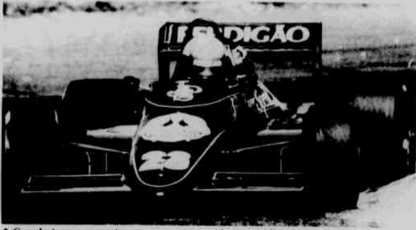
* Gugelmin quer repetir o sucesso conseguido em 1985.

Apesar de vencer o Campeonato Inglês de Fórmula 3 no ano passado, o piloto brasileiro não consegue agora repetir suas boas apresentações.