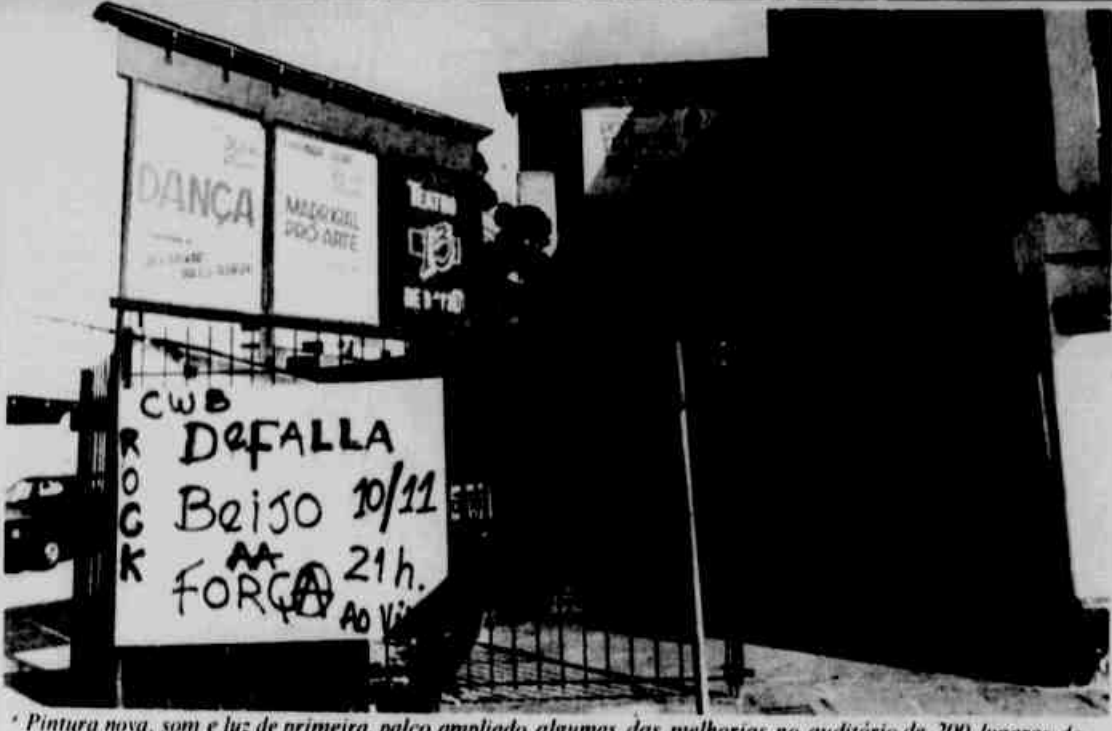
* Pintura nova, som e luz de primeira, palco ampliado, algumas das melhorias no auditório de 200 lugares do Teatro 13 de Maio.

Junho, sexta-feira 13. O Teatro 13 de Maio, prometa e única iniciativa de um teatro particular em Curitiba, desvinculada de instituições e fundações de qualquer natureza, completa hoje um mês de existência. E neste primeiro balanço mensal constatou-se que vai muito, mas muito bem. O antigo Teatro da Classe, gerenciado pela Associação Paranaense dos Produtores de Artes Cênicas - Apac - ganhou novos responsáveis - as companhias de teatro Tamandua, NBP e Divinos Comediantes (três companhias ligadas a Apac que se uniram, foram eleitas pelo conselho da entidade e entraram de posse em julho e agora assumida de dar nome e alma na tarefa assumida de dar um importante espaço cultural da cidade que por sua ociosidade, corria o risco de fechar suas portas novo nome, nova sede, propostas, programação variada de segunda a domingo, ampliação e melhoria do espaço e principalmente uma nova concepção na ocupação de um espaço onde as mais variadas opções de trabalho e atenção com a formação e o trabalho de público e formação profissional de novos artistas, abrigam-se sob o mesmo teto.