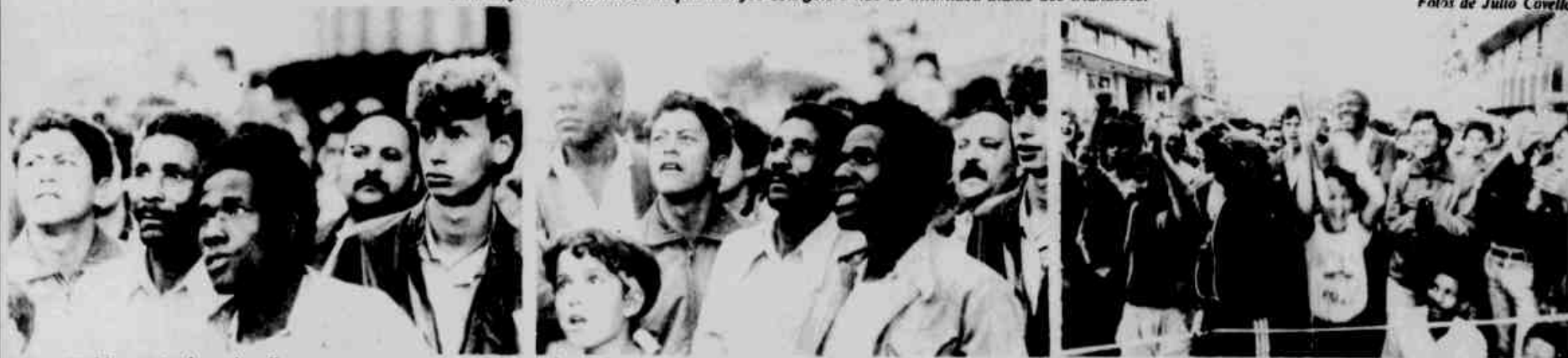
* Boca Maldita, meio da tarde: olhares tensos acompanham os lances do excelente jogo. Os sorrisos começam a nascer no momento em que surge a possibilidade um gol. E aí acontece a explosão da torcida.