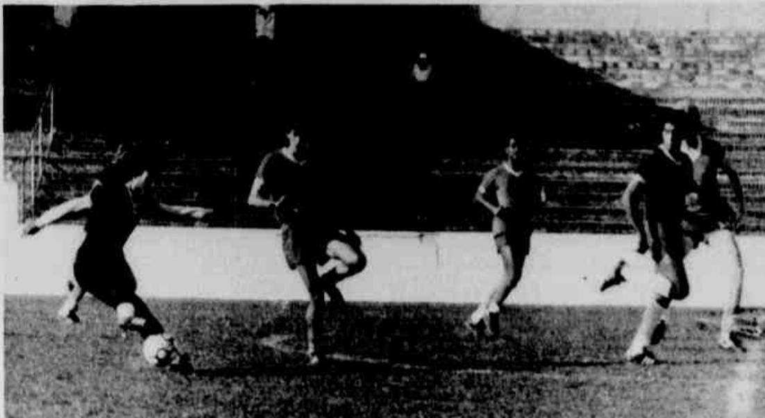
* O Atlético treina descontraído para o jogo de domingo.

N um clima de bastante descontração, refletindo a boa fase que o clube atravessa na Copa Brasil, o Atlético desce hoje pela manhã para o litoral, onde os jogadores terão dois dias de treinamento como parte da preparação para o jogo de domingo em Salvador, contra o Bahia, na estreia dos dois times na segunda fase da competição.