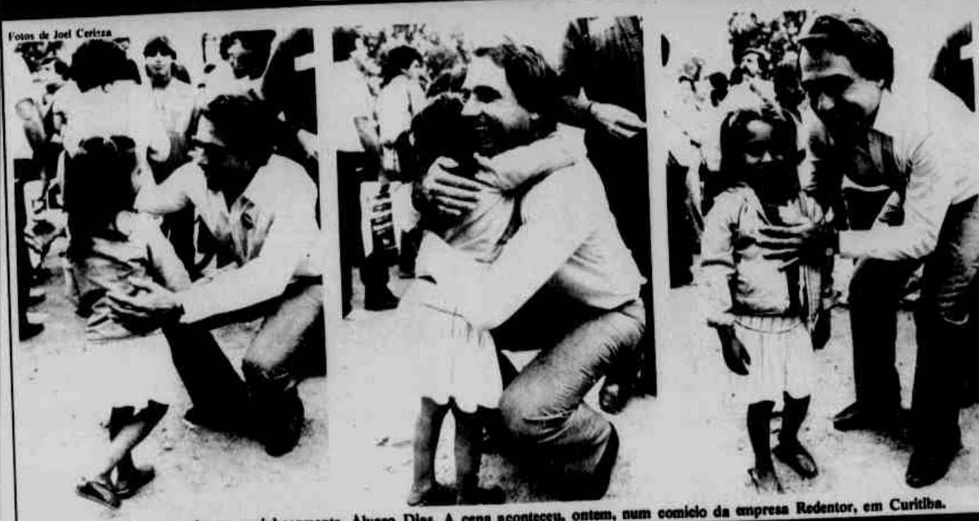
A pequena fã corre e abraça, carinhosamente, Alvaro Dias. A cena aconteceu, ontem, num comício da empresa Redentor, em Curitiba.

O senador Álvaro Dias, candidato do PMDB ao governo do Estado, disse, ontem, que as greves não podem prejudicar o partido, "até porque a própria existência da greve deve-se ao PMDB". Alvaro acrescentou que, "se não fosse o PMDB, os grevistas não estariam livres".