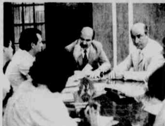
* O secretário e o diretor da polícia, negam existência da greve.