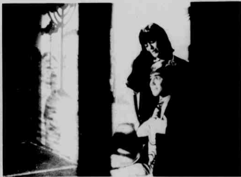
* Uma cena da peça "La Nuit de L'Absurde".

Dando continuidade ao trabalho iniciado no ano passado, o Grupo de Teatro da Aliança Francesa de Curitiba apresenta agora dois espetáculos: dias 10, 11 e 12 de outubro (sexta, sábado e domingo), "LA NUIT DE L'ABSURDE", e dias 17, 18 e 19, "CLASSE TERMINALE". Todas as apresentações serão no Teatro 13 de Maio, às 21 horas.