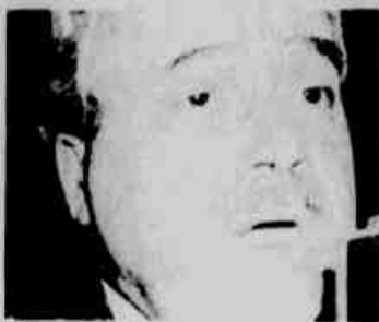
* Brossard: assim não dá.

As constantes reclamações contra os vereadores que promovem aumentos aos próprios salários levaram Brossard a agir junto ao STF.