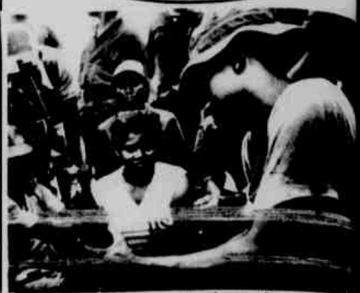
Fronteira Honduras, Nicarágua — Recrutados do grupo guerrilheiro anti-sandinista Kisan, aprendem a manejar armas, em uma foto tomada em agosto de 86, enquanto esperam 100 milhões de dólares de ajuda dos Estados Unidos.