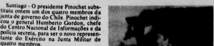
* Pinochet tem mandato até 1989.

Enquanto o comandante da Força Aérea do Chile admite conversações com a oposição, o presidente Pinochet substituiu ontem um membro da Junta Militar.