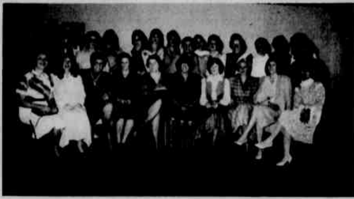
* O "Chã da Primavera", realizado em Araucária, reuniu os mais expressivos nomes de nossa sociedade.