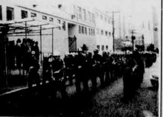
Desfile da Tropa em continência às autoridades presentes.

Finalizando a solenidade, foi inaugurado o retrato do coronel Antônio Amarty Dittrich, na galeria dos ex-comandantes do Corpo de Bombeiros da Polícia Militar do Paraná.