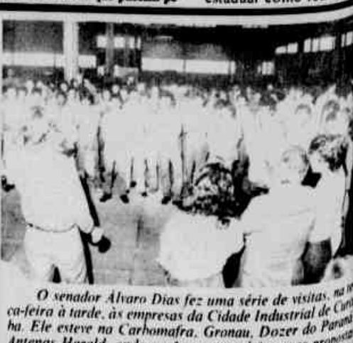
O senador Alvaro Dias fez uma série de visitas, na sexta-feira à tarde, às empresas da Cidade Industrial de Curitiba. Ele esteve na Carhomafra, Gronau, Dozer do Paraná e Antenas Harald, onde expôs aos operários suas propostas.

● O vereador Neivo Bredin lastimou ontem que anteprojeto da nova Constituição do Brasil não seja o menor de idade de violência dos pais e da cidadania. O vereador exigiu a campanha que Proppar do Estado que promovendo contra a violência infantil. "A violência contra o menor praticada nunca foi motivo de preocupação por parte de membros do governo, estadual como federal".