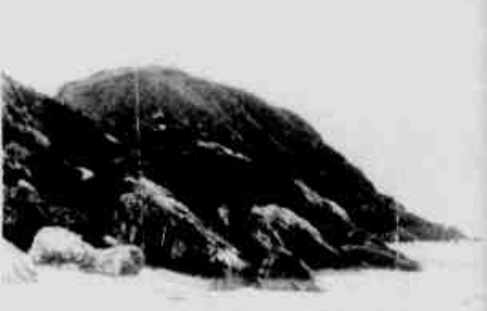
* Um fenômeno ainda não explicado.

Há aproximadamente cinco anos e com maior intensidade nos últimos meses, uma alteração nas marés inverno está fazendo com que, gradativamente, a Ilha do Mel, no litoral do Paraná, vá perdendo suas praias.