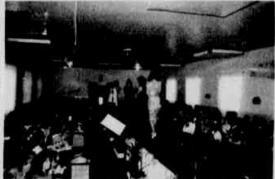
* Aspecto do desfile do "Chã da Primavera".