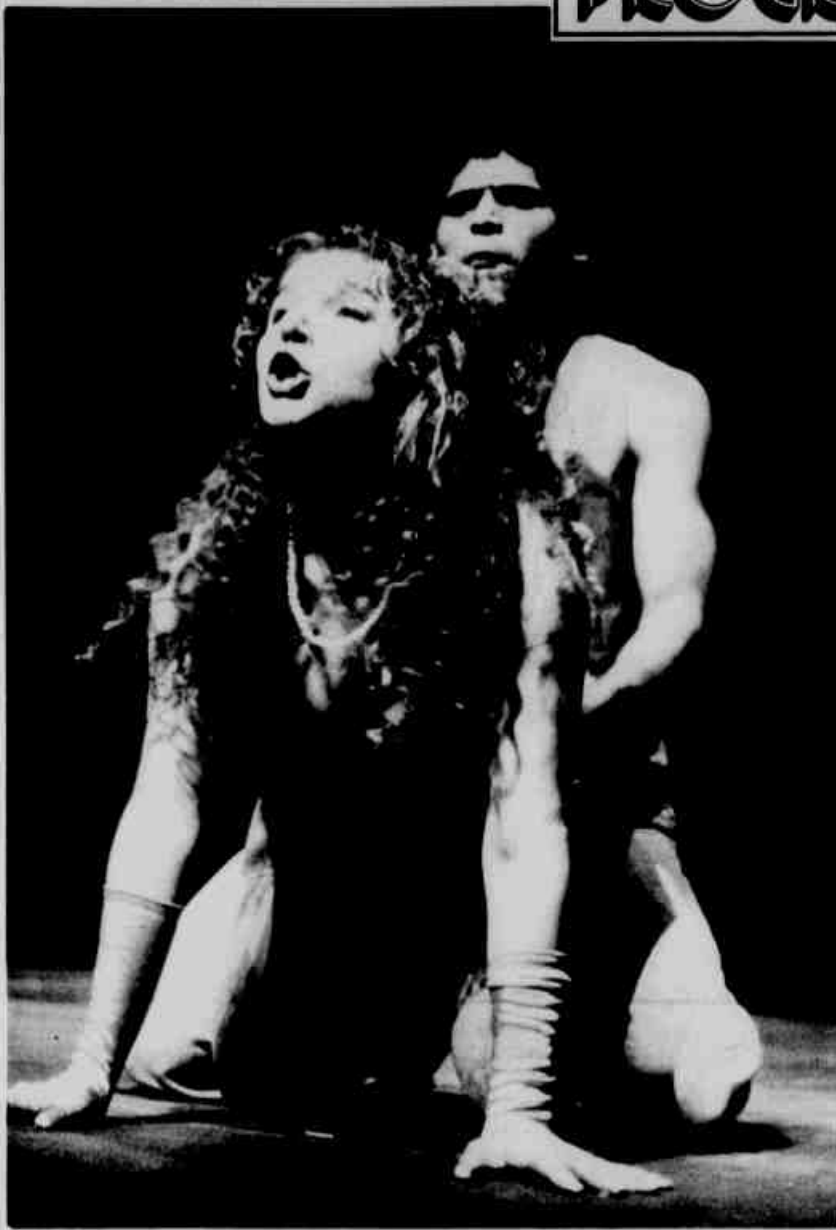
* "A Peste", estreia amanhã no Teatro Guairá.

Entretanto, a partir do momento em que a mais ínfima esperança se torna possível para a população, o reinado efetivo da peste termina. E então, todos passam a pensar na maneira pela qual a vida se reorganizará. Reaberta a cidade libertada da peste, será definitiva a vitória?