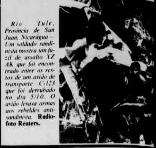
Rio Tule, Província de San Juan, Nicarágua — Um soldado sandinista mostra um fuzil de assalto XZ AK que foi encontrado entre os restos de um avião de transporte C-123 que foi derrubado no dia 5/10. O avião levava armas aos rebeldes anti-sandinista.