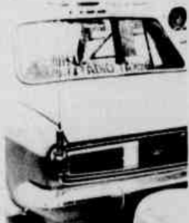
* Os rádio-táxis.

Os taxistas ligados às centrais de chamada por rádio pretendem cobrar ágio sobre o preço da bandeirada, exigindo dos usuários uma taxa de C$ 6,50 pelo deslocamento desde o ponto em que se encontram até o lugar onde o cliente inicia a corrida.