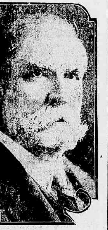
Figuras universaes que nos visita rão: o principe de Galles, almirante Thon de Revel, marechal Joffre e Sr. Charles Hughes

que as radições de apothéoses e mascaradas, ornadas de flores e sorrisos de pálar. Quem nos ha de cusinar porque os palcos Centenario, Independência e Brasil, mudam de sentido a cada segunda e mudam diferentes no seu significado para cada individuo, e se combinam uma, duas, e em cada uma dessas combinações vem uma multiplicidade de significados Centenario da Independência do Brasil, e estamos a ver o fundo glorioso da tela de Pedro Americo, Centenario da Independência do Brasil, e eis que nos animo a aurora já distante do 15 de Novembro. Mais uma, mais outra e outra vez se repetem os vocabulos e todos recendem ao grande Centenario da Independência do Brasil, e eis que nos animo a aurora já distante do 15 de Novembro. Mais uma, mais outra e outra vez se repetem os vocabulos e todos recendem ao grande Centenario da Independência do Brasil, e eis que nos animo a aurora já distante do 15 de Novembro.