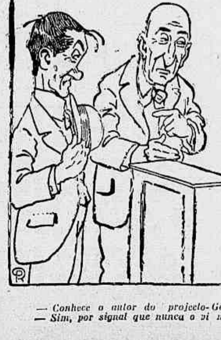
— Conhece o autor do 'projeto-Gordó? — Sim, por signal que nunca o vi mais magro!

O julgamento dos socialistas revolucionarios REVAL, 29 (Havas) — Noticias só hoje recolhidas aqui informam teve inicio quinta-feira ultima, em Moscou, o julgamento dos socialistas revolucionarios russos.