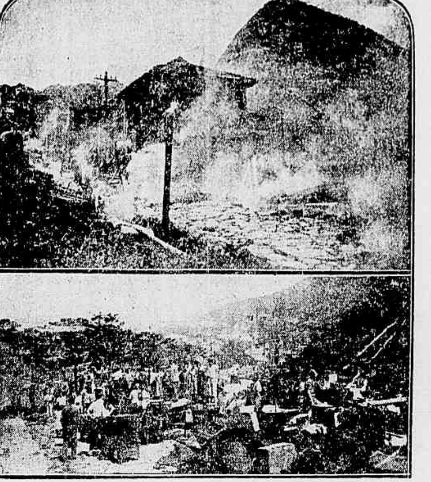
Na hora do fogo. Em cima: as casas incendiadas, quando o fumo e as labaredas as envolvião. Em baixo: moveis salvos das casas vizinhas as que pegaram fogo

Operaram por alguns momentos, esta tarde, tomados de pânico os operarios da Fabrica de Tecidos Alliança, situada à rua das Laranjeiras. E' que um grupo de casinhas, residencia de familias dos que moram naquella fabrica irrompeu, com violencia assistida, um grande incendio. Mal começaram as chamas a erpitar, propagando-se rapidamente, foi dado alarma. De todos os lados correram populares, ao mesmo tempo que, abandonando o trabalho, os operarios da Ali-