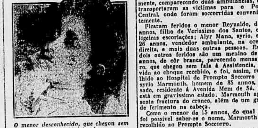
O menor desconhecido, que chegou sem fala na Assistência

de da Jardim Botânico. O que houve a cada instante se assistiu em todos os bon-des a uma explosão na caixa automatica. Esse facto, que é commum, teve, hoje, entretanto, resultados lamentaveis. O bonde em que se deu o accidente foi o de n. 27.