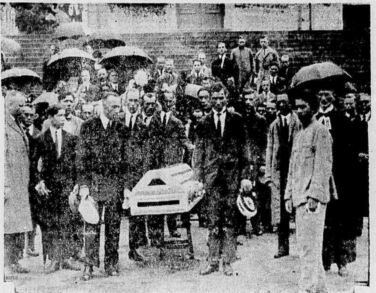
Na Escola Cedro do Libano