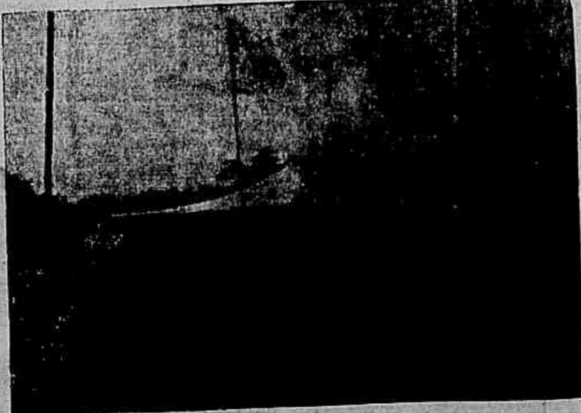
BARRACA TORTOISE (fechada), adoptada pela Brigada Militar

graves em leves accidentes, dando lugar, ás vezes, a salvar muitos soldados da imminencia da morte. Os accidentes do terreno, ou obstaculos por ventura ali encontrados ou ainda a falta de padiola impropria, ás vezes, o transporte dos feridos a braço e em grandes distancias, e que o torna penoso.