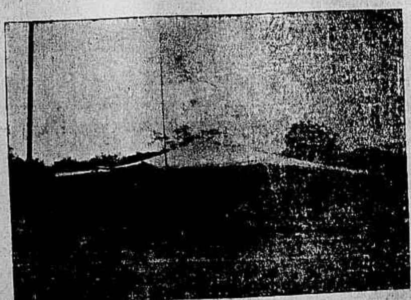
BARRACA TORTOISE (aberta)

Assim formada a cadeirinha, o ferido procura sentar-se pelo modo mais facil, passando os braços em torno dos pes-