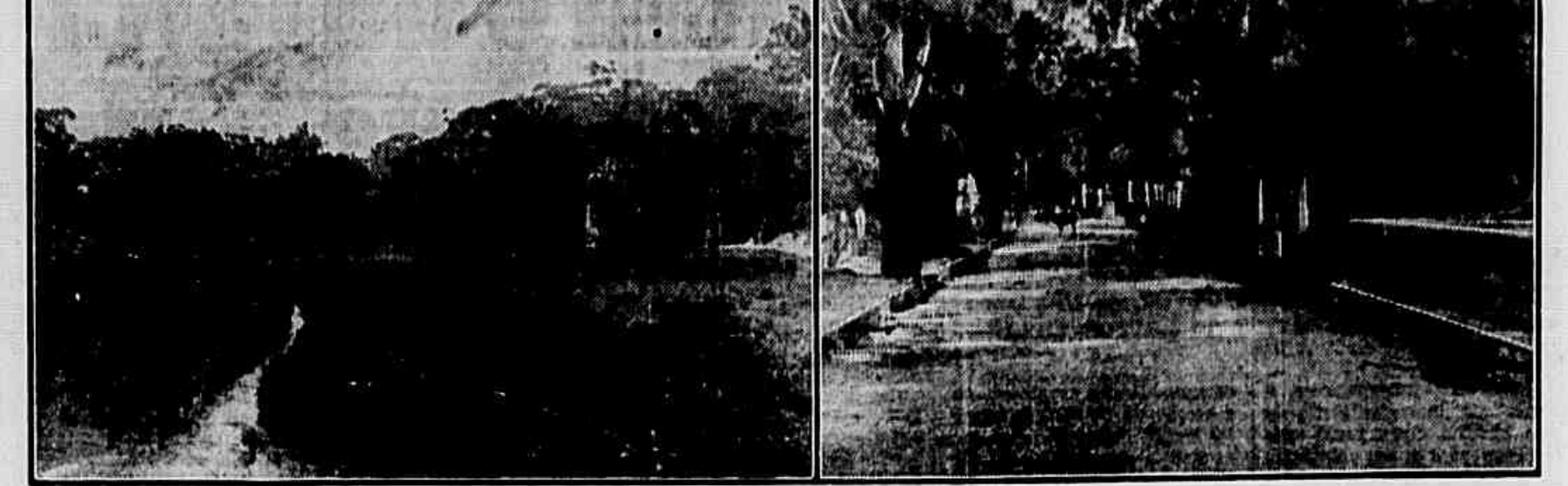
Aspecto do Jardim da Aclimação que comprovou o seu abandono pela Prefeitura; invadido pelo capim e pela erva daninha, tendo por únicos habitantes os burrinhos da Municipalidade. Apenas 5 trabalhadores cuidam da sua limpeza.