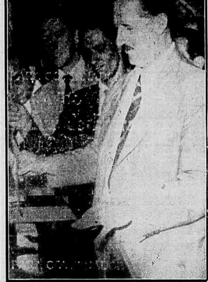
O sr. Adhemar de Barros, quando depositava na urna seu voto.

TUDO BEM EM MATO GROSSO CUIABÁ, 20 (Aspress) — Os trabalhos em todos as seções encerraram-se normalmente. As primeiras notícias recebidas ontem, a