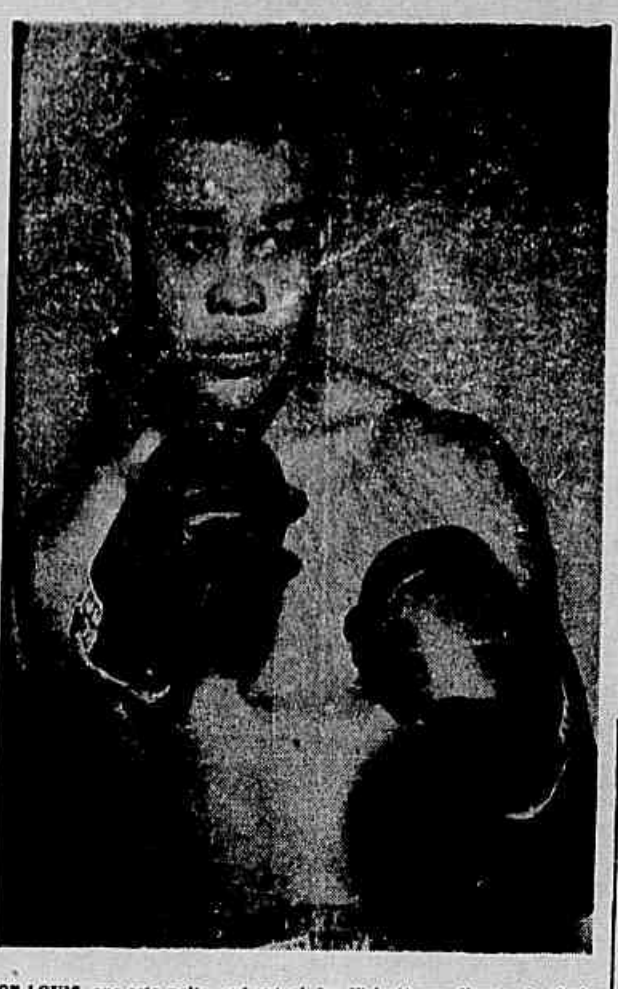
JOE LOUIS, que esta noite, enfrentará Joe Walcott, em disputa do titulo de campeão do mundo de todos os pesos.

A proxima rodada do certame de profissionais de futebol carioca foi dividida para efeito de rodada. Os jogos Fla-Flu e S. Cristóvão-Americano, já foram antecipados para amanhã à tarde. Assim sendo o classico Vasco da Gama e Botafogo e os jogos Bangu-Olaria e Canto do Rio-Madureira ficarão para domingo vindauro. Em virtude de uma concessão dos clubes que resolveram antecipar os seus jogos a proxima rodada constará de dois grandes clássicos disputados separadamente.