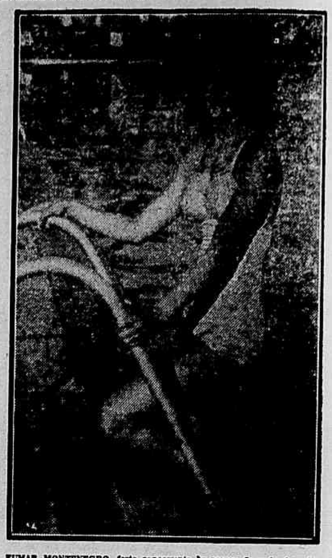
EMAR MONTENEGRO, forte concorrente às provas de nado de peito.