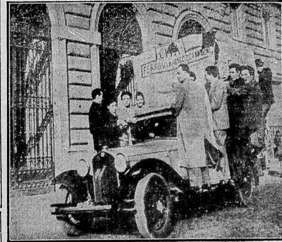
GREVES NA ITALIA — Durante a recente greve geral em Milão, os habitantes daquela cidade do norte da Itália foram obrigados a recorrer aos mais variados meios dos transportes, como mostra o clichê.