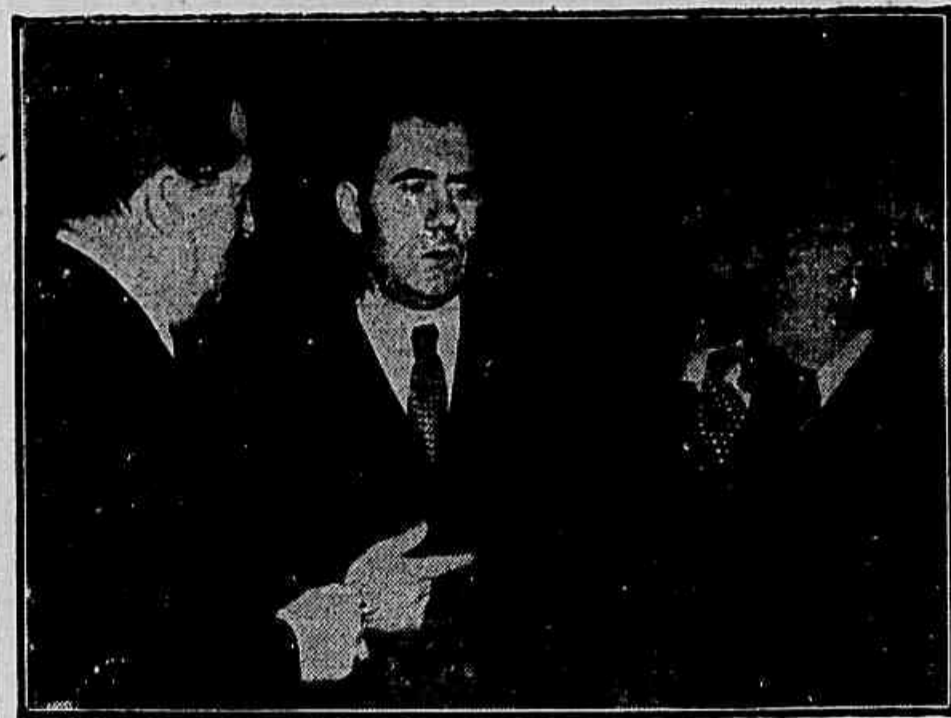
A PARTILHA DA TERRA SANTA — Fugiente tomado durante a histórica sessão da Assembleia Geral da ONU, na qual foi aprovado o plano de divisão da Palestina. Vem-se, da esquerda para a direita, Herschel Johnson, dos EE. Unidos e os delegados soviéticos Gromyko e Vishinsky.