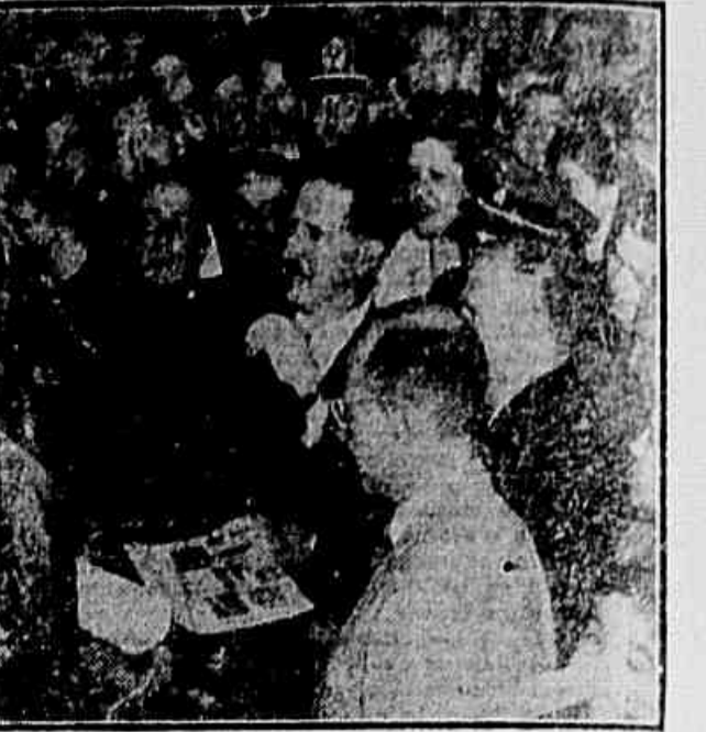
Flagrante da visita aos pavilhões, quando o governador Adhemar de Barros e comitiva observaram o mostruário do Instituto do Habitação...