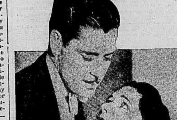
Kay Francis numa cena com Ronald Colman

lhou a imediata remoção da paciente para o hospital. Kay Francis, que não entrou no hospital, havia perdido os sentidos, mais tarde os recordou, depois de ter sido submetida à aplicação de um baio de oxigênio. Explicando a razão do emprego desse recurso, o médico assistente de Kay Francis informou que ela sofreu do aparelho respiratório. Relativamente à espécie do ferimento apresentado pela famosa estrela cinematográfica, os médicos do "Hospital White Cross", onde ela está internada, negaram predominantemente a prestar