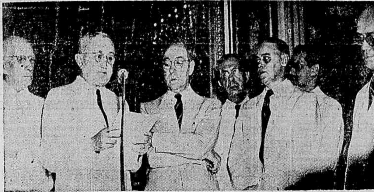
UNIÃO PELO BRASIL — Frangente da cerimônia da assinatura do Acordo Interpartidário, quando falava o chefe da Nação, ladoado pelos srs. Artur Bernardes e Nereu Ramos. Vêem-se, ainda, os senadores José Americo e Ivo de Aquino.

Referindo-se a outros aspectos da política britânica, Atlee defendeu o Plano Marshall. E mencionou a possibilidade de uma nova reunião dos 16 Nações participantes do Plano. Churchill disse que a invenção da bomba atômica deu ao Ocidente uma "pausa" de