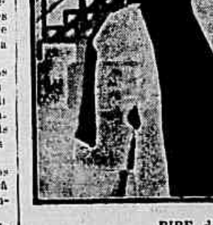
BIBE, defensor do Ipiranga

3.200 cruzeiros mensais receberá o magnifico meia-esquerda alvi-negro