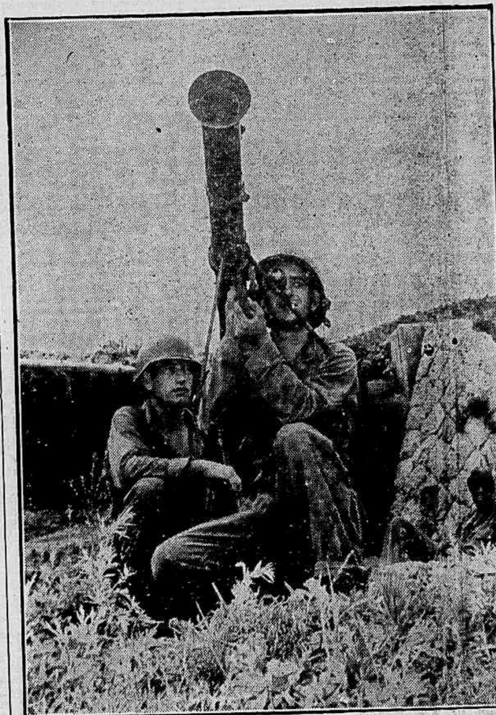
A NOVA "BAZUCA" — A fotografia mostra um soldado norte-americano com a nova "bazuca" de 3,5 polegadas na frente de batalha na República da Coreia. Essa arma, aperfeiçoada da que foi usada na Segunda Guerra Mundial, disparava um projétil que pode perfurar uma blindagem de 25 centímetros

LONDRES, 24 — (UP) — Acreditava-se que o Brasil faria grandes encomendas de aviões a jato propulsão na Inglaterra, afirmou o diretor da indústria aeronáutica britânica. Essas compras de aviões a jato pelo Brasil seriam o resultado da visita do doutor Cesar Grillo, diretor do Departamento da Aeronáutica Civil. O doutor Cesar Grillo, que aqui chegou no dia 18 último em companhia de sua esposa, inspecionou vários tipos de aviões britânicos a jato propulsão atualmente empregados pelas companhias de aviação britânicas.