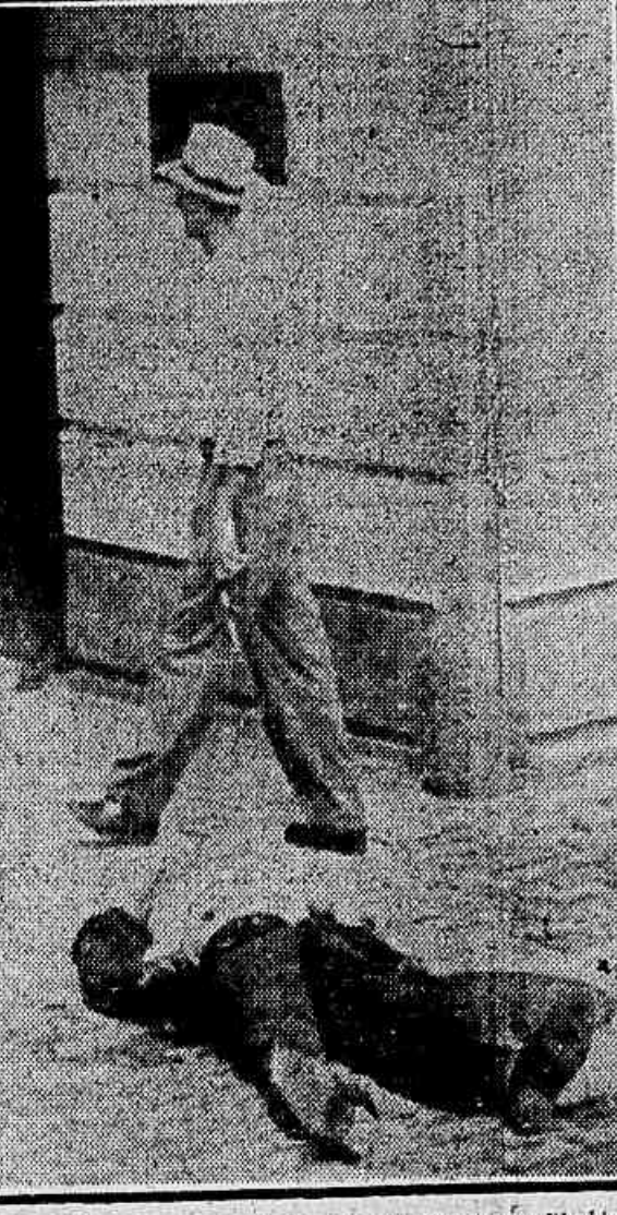
A REVOLTA DE PORTO RICO — A revolta irrompeu em Porto Rico, embora prontamente dominada, teve ramificações em Washington, com a tentativa contra a vida de Truman. No clichê, à esquerda, vê-se o líder nacionalista Pedro Albizu Campos, chefe dos conspiradores, e que se encontra detido. À direita, o cadáver de um dos assassinos do palácio presidencial em San Juan, sendo-se um inspetor de polícia, com o revolver na mão, pronto para abater outros participantes do ataque.