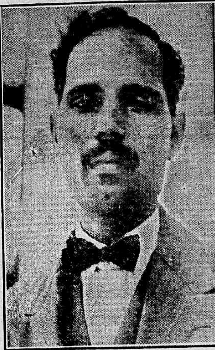
A REVOLTA DE PORTO RICO — A revolta irrompeu em Porto Rico, embora prontamente dominada, teve ramificações em Washington, com a tentativa contra a vida de Truman. No clichê, à esquerda, vê-se o líder nacionalista Pedro Albizu Campos, chefe dos conspiradores, e que se encontra detido. À direita, o cadáver de um dos assassinos do palácio presidencial em San Juan, sendo-se um inspetor de polícia, com o revolver na mão, pronto para abater outros participantes do ataque.