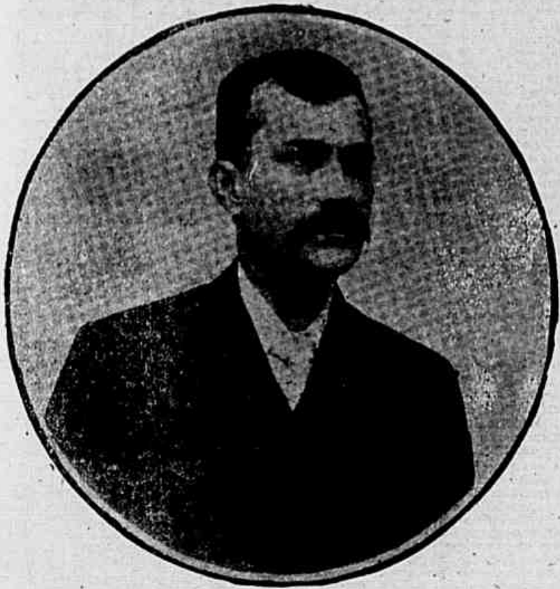
Dr. Delfim Moreira, presidente do Estado de Minas

Um documento de alta, significação para a politica nacional