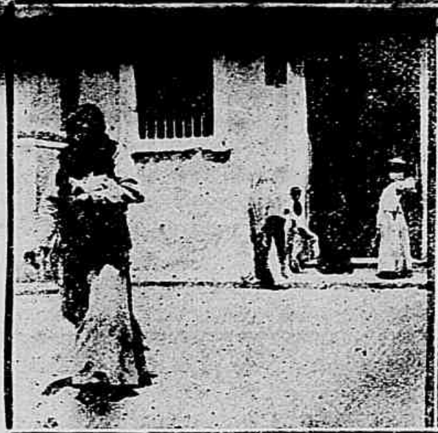
Sahida e entrada da portaria