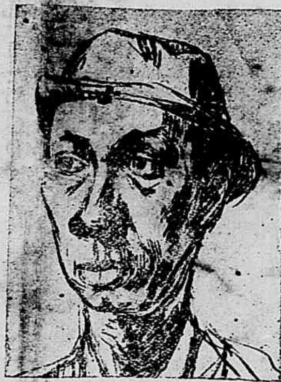
Ad vocati... ad "cavationes"...

O Sr. intendente municipal n'estes tres atribulados annos de sua accidentada administração já deve estar bem convencido, por amarga e propria experiencia, da verdade muito velha mas sempre esquecida de que os excessos prejudicam.