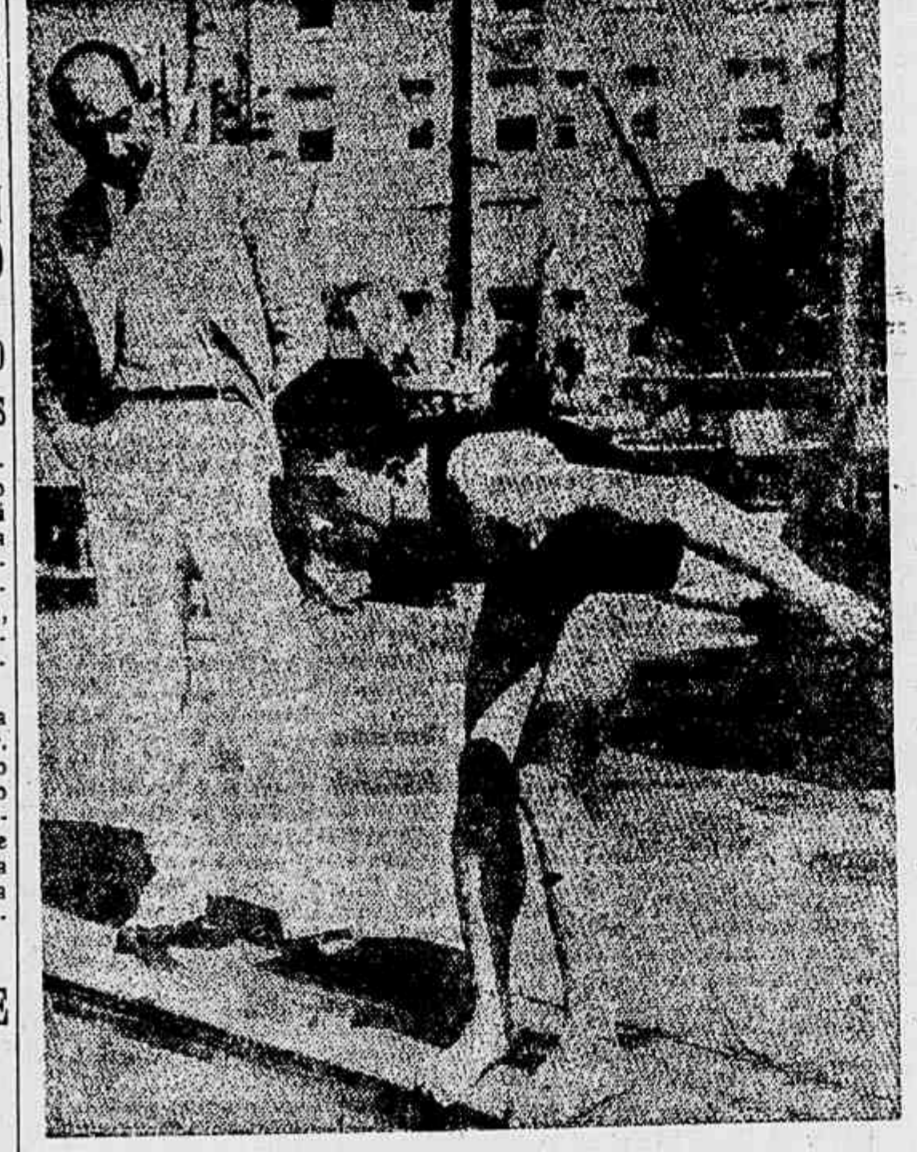
O representante do Japão na prova de 200 metros, exercitando-se sobre a direção do seu treinador