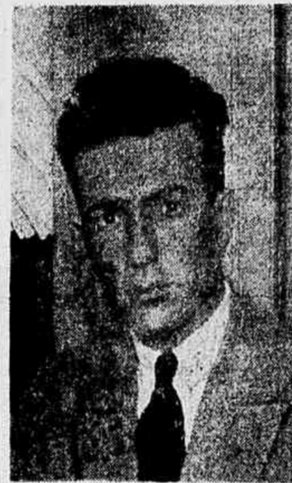
Uma nova seção do "CORREIO DE S. PAULO"

O CORREIO DE S. PAULO iniciará em breve a publicação de uma nova seção, sobre quiromancia, que cons-