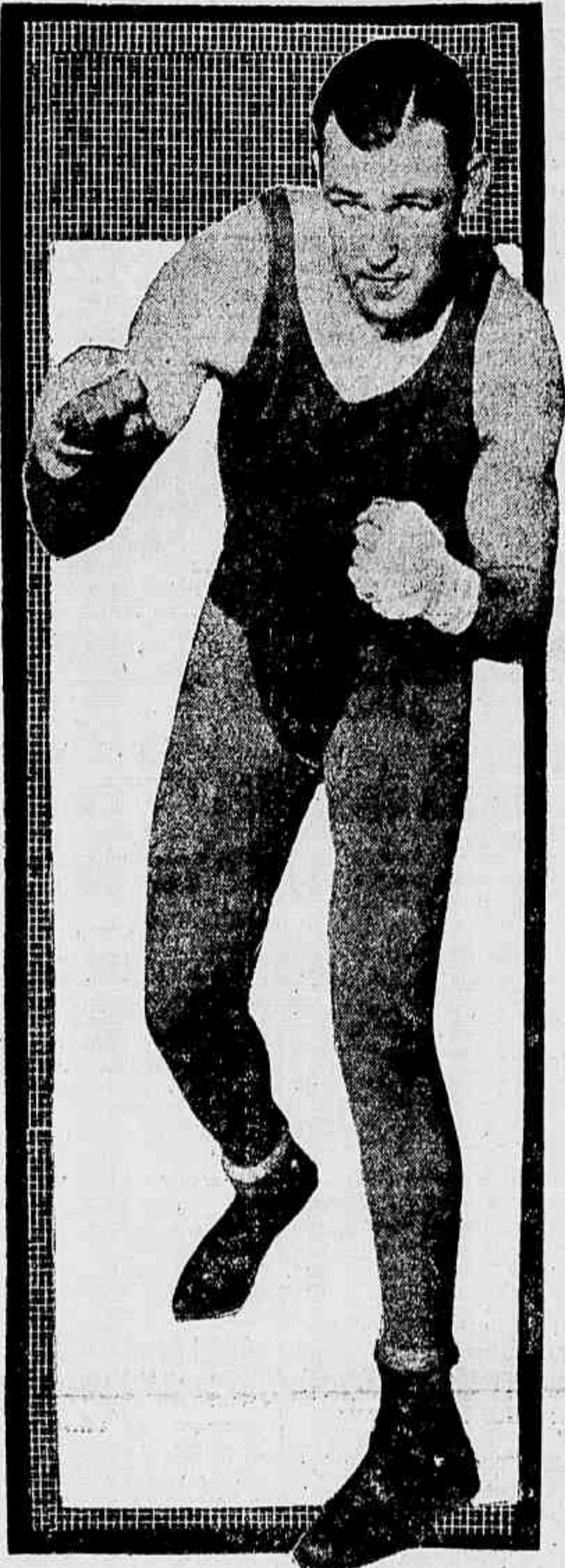
JACK SHARKEY, o novo campeão mundial de pesos pesados

querdo fechado e sangrando. Depois de receber vários golpes, o americano reage e atinge por 3 vezes as mandíbulas de Max. Golpes revesados entre os dois, no centro do "ringue", até que Max manda um em cheio contra o coração de Sharkey que resiste bem. Max insiste nos golpes de direita, e o americano nos de esquerda. Encerrou-se o "round" com vantagem de Max.