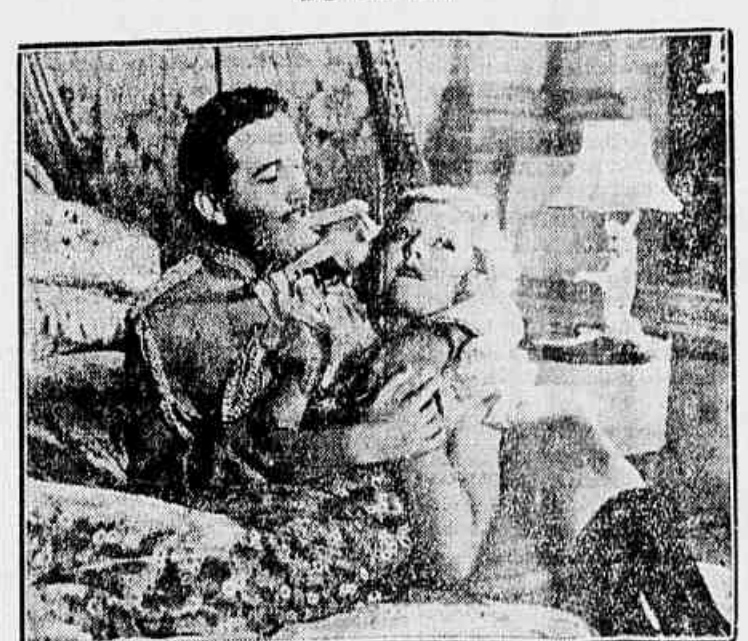
Uma scena da super-produção Fox "Meus Labios revelam", interpretada pelos famosos actores Lilian Harvey e John Boles, que o Odeon na sua Sala Vermelha nos dará hoje