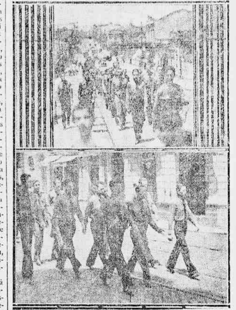
UM DESFILE DOS "CAMISAS-VERDE" HONTEM PELA MANHA

A Revolução teve o merito de fazer nascer novas correntes de opinião, entre nós. Hoje, já temos os camisas "pardas", "olivas" e recentemente as "brancas". Hontem, houve uma grande parada dos "Camisas-olivas", nucleados na "Acção Integralista"