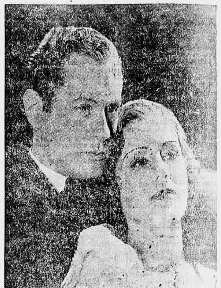
Robert Montgomery e Madge Evans, os principaes interpretes da soberba produção Metro "Além do Inferno", que hoje será apresentada na tela do Cine Paramount

Um brilhante feito da Metro-Goldwyn-Mayer — A grande festa de hoje no Cine Paramount — Os maiores criticos americanos e ingleses disseram: é um milagre de technica e uma afirmativa vigorosa dos estudos da M. G. M.!