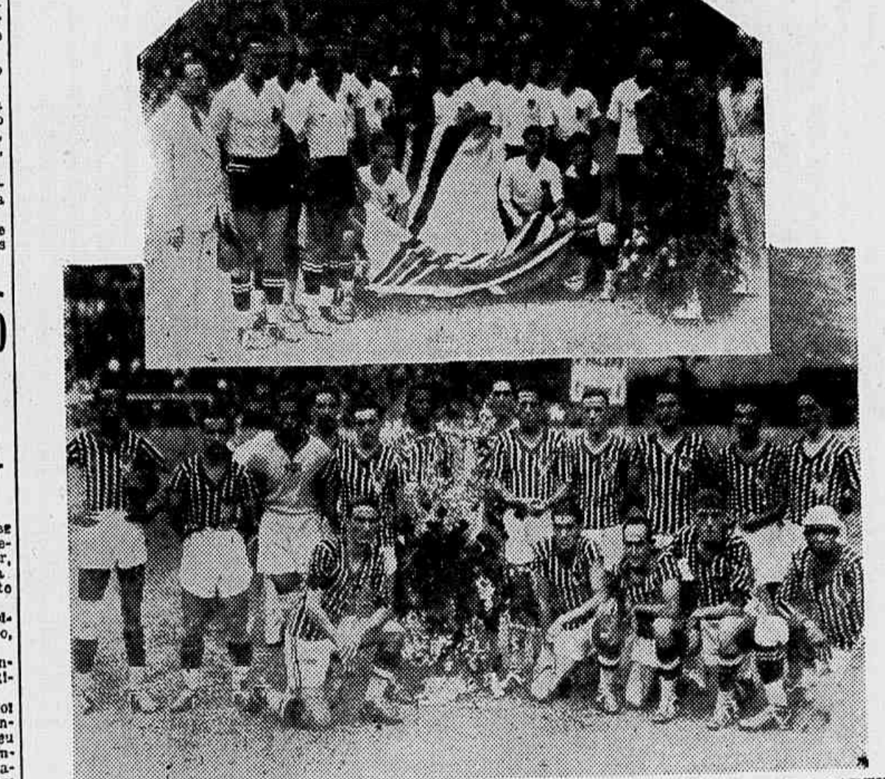
AO ALTO: O "ONZE" GAUCHO. EM BAIXO: A TURMA PAULISTA, VENCEDORA DA PARTIDA