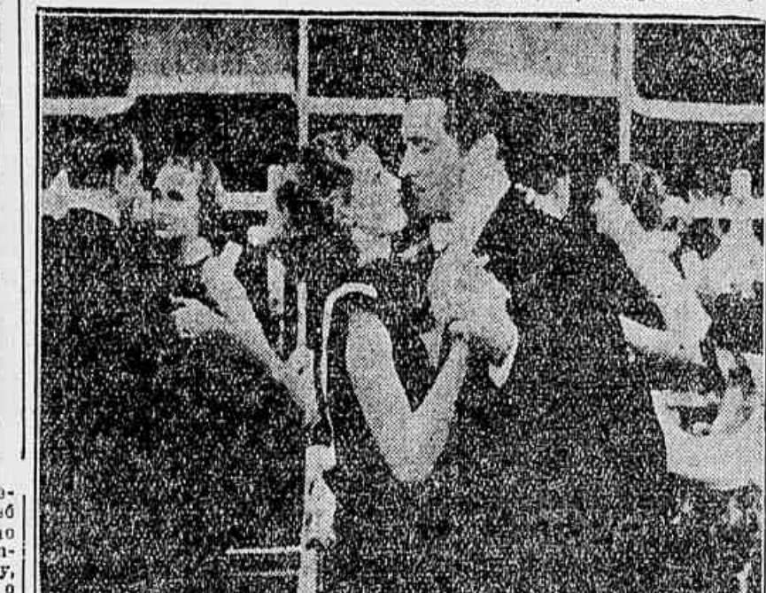
Uma scena do filme "Legião das Abnegadas"