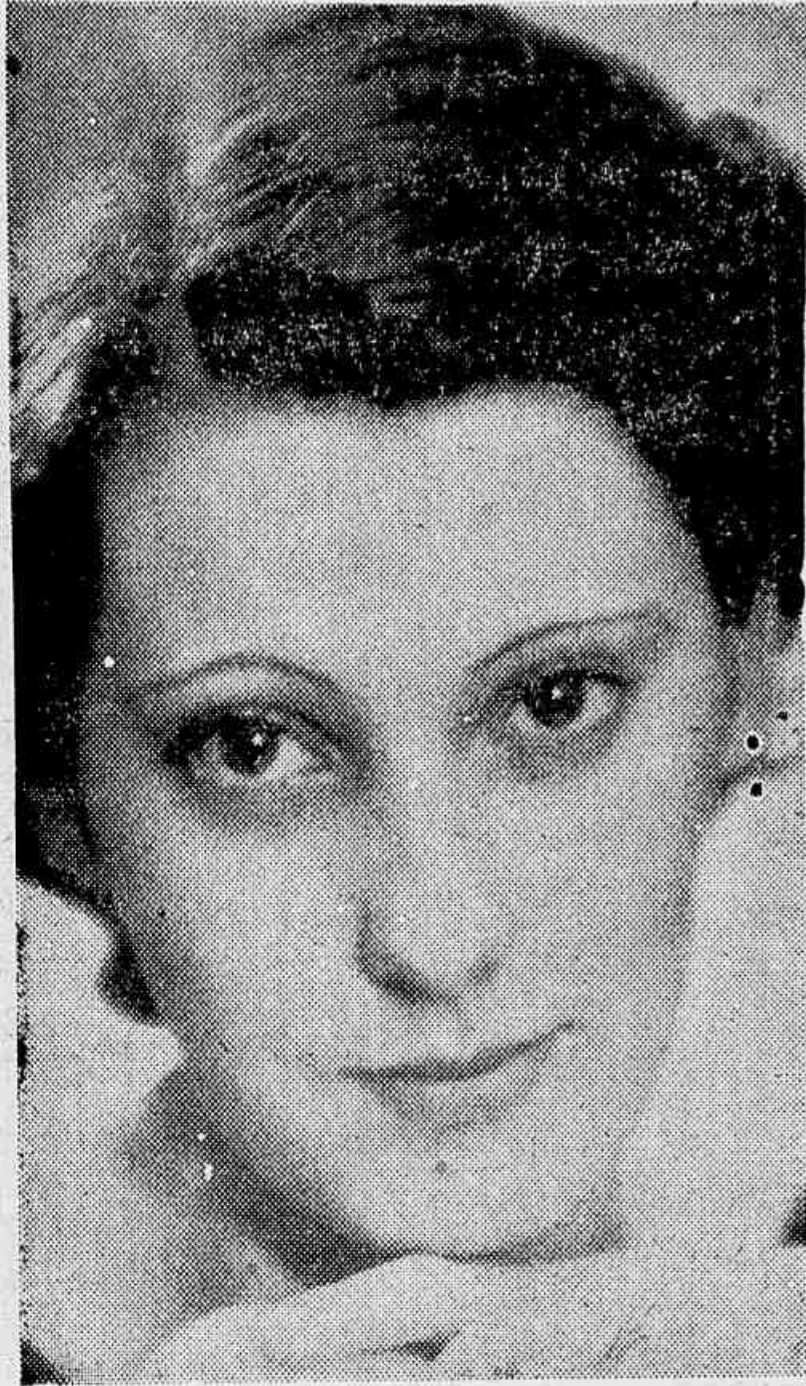
"S. M. A RAINHA DA CIDADE" EM 1935, CUJO REINADO PRINCIPIA HOJE

Pedimos a todos quantos participarão do Grande Desfile da "Rainha da Cidade", "Grupos", "Blocos", "Cordões", "Ranchos", corporações musicacs, comitivas das associações esportivas e recreativas, o pontual comparecimento ás 20 horas de hoje, na praça Julio Mesquita, (av. S. João), de modo que a marcha do desfile se inicie impreterivelmente ás 20,30 horas.