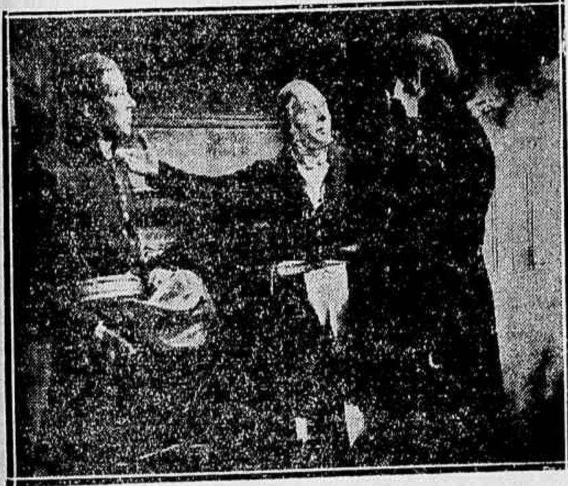
Uma scena do filme “O Duque de Ferro”

GEORGE ARLISS NO PAPEL DE WELLINGTON O VENCEDOR DE NAPOLEÃO