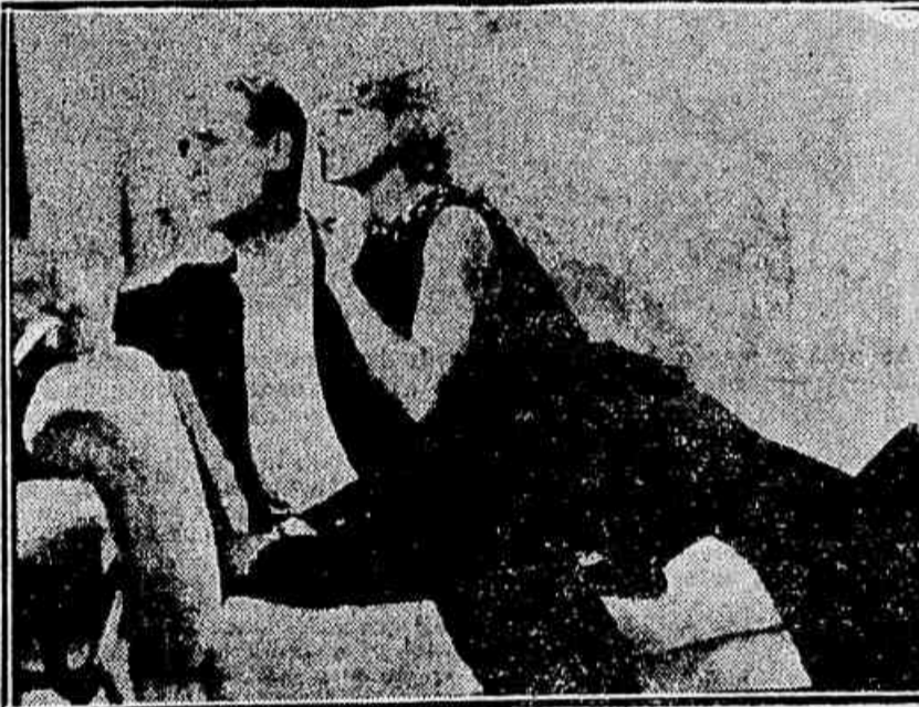
Uma scena do filme “Uma noite de amor”