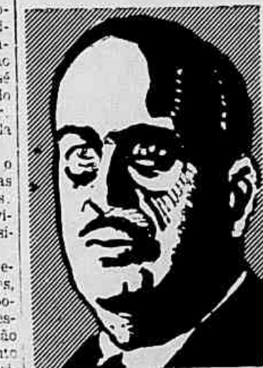
Ministro Arthur Costa

RIO, 13 (O Imparcial) — O Tribunal de Contas officiou ao ministro da Fazenda, acerca do reajustamento dos vencimentos dos militares e indagando si o credito solicitado corre pelos recursos ordinarios do Thesouro ou si se torna preciso a abertura duma operação de credito. Esta pergunta originou-se do facto de haver, ha tempos, o Ministerio da Fazenda remetido ao referido Tribunal, para o necessario exame, o total dos creditos indispensaveis ao reajustamento. Este processo foi nontem devolvido ao Ministerio da Fazenda.