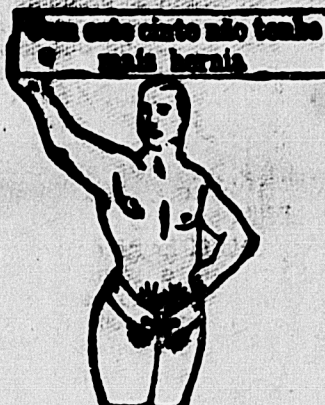
Cinto Luva invisível