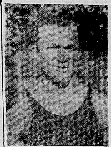
Manoel Villar — o grande nadador brasileiro, um dos serio concorrentes ás Olympiadas de Berlim

ROMA, 13 — (O IMPARCIAL) Os technicos italianos, empenhados em que este paiz faça uma boa figura em nataçao nas proximas Olympiadas de Berlim, ao correr do anno proximo, concentram suas melhores esperanças em Cappellini Dino, detentor do record nacional de 100 metros nadado livre, com 1 minuto, 2 segundos e 1/10 mo.