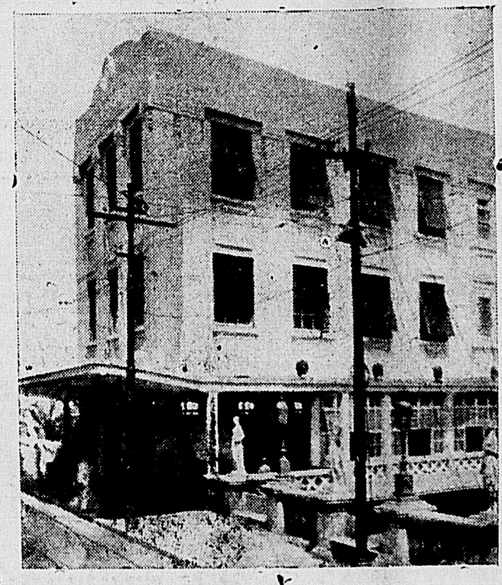
O edificio Lacerda, da E. Elec. P. a., para cujas cefes a população concorre com 1/3 sobre o valor das contas em atraso de... post. cos diás.

A "Circular" não toma conhecimento da Lei