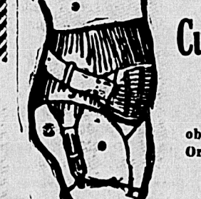
Cinto para Ptosis (otomago caído)

Paris e Roma, tendo sido o mesmo proprietario e director da casa de saúde para Operação da Hernia durante vinte annos, com 30 annos de pratica orthopedica residindo desde 1912 no Rio de Janeiro, á Av. Gomes Freire 146, especialista conhecido, servindo em hospitaaes, casas de saúde e tendo a approvação e confiança de todos os medicos illustres da Capital e do mundo inteiro podem os senhores e Exmas. Senhoras obter saúde e cura collocando os inimitaveis cintos e cintas conformes a doença, sejam Hernias Inguinaes, escrotaes, cruraes, umbelicaes, rins movels, Intestino caído, ventre dilatado e caído anus illico, Cinto Post Operações, etc., fabricados caso por caso com o maximo cuidado, segundo os ultimos dados scientificos da orthopedia moderna.