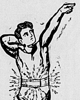
Cinto Electrico para dores reumaticas, impotencia, anemia debilita nervosa e neurasthenia

O intestino é um tubo delgado, que sob a minima pressão deixa de funcionar, produzindo dores atrozes e estrangulamento do mesmo e a