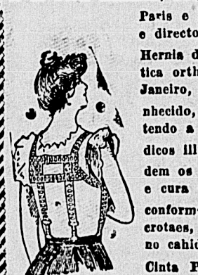
Cinto de ventre caído pisenhoras