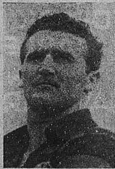
BELFARE, treinará hoje

Artigos para praias Chuteiras e Materiais para Esporte CASA WALTER