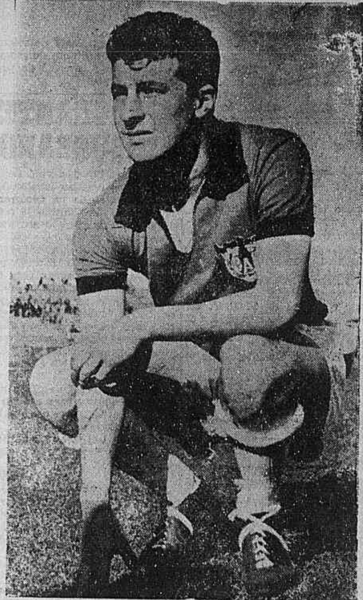
PIRANHA é um exemplo típico. Vigoroso, portador de boas virtudes, poderia ser um êxito se lançado após um estágio convincente e bem orientado. Todavia, "lançado às ferás", continua sendo uma incógnita. Serve ou não serve. Presta ou não presta?

A base continua sendo boa. Valdir, Bezelin, Tozin, Lineu, Piranha, Éto e outros, têm vir-