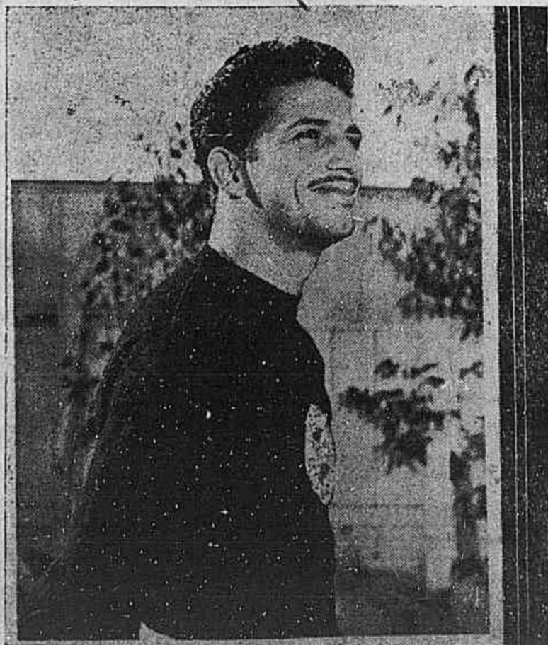
ADAIL, segue hoje para Ponta Grossa.

SEGUE HOJE O ARQUEIRO ALVI-NEGRO, AVISTANDO-SE COM OS DIRIGENTES DO GUARANI E. C.