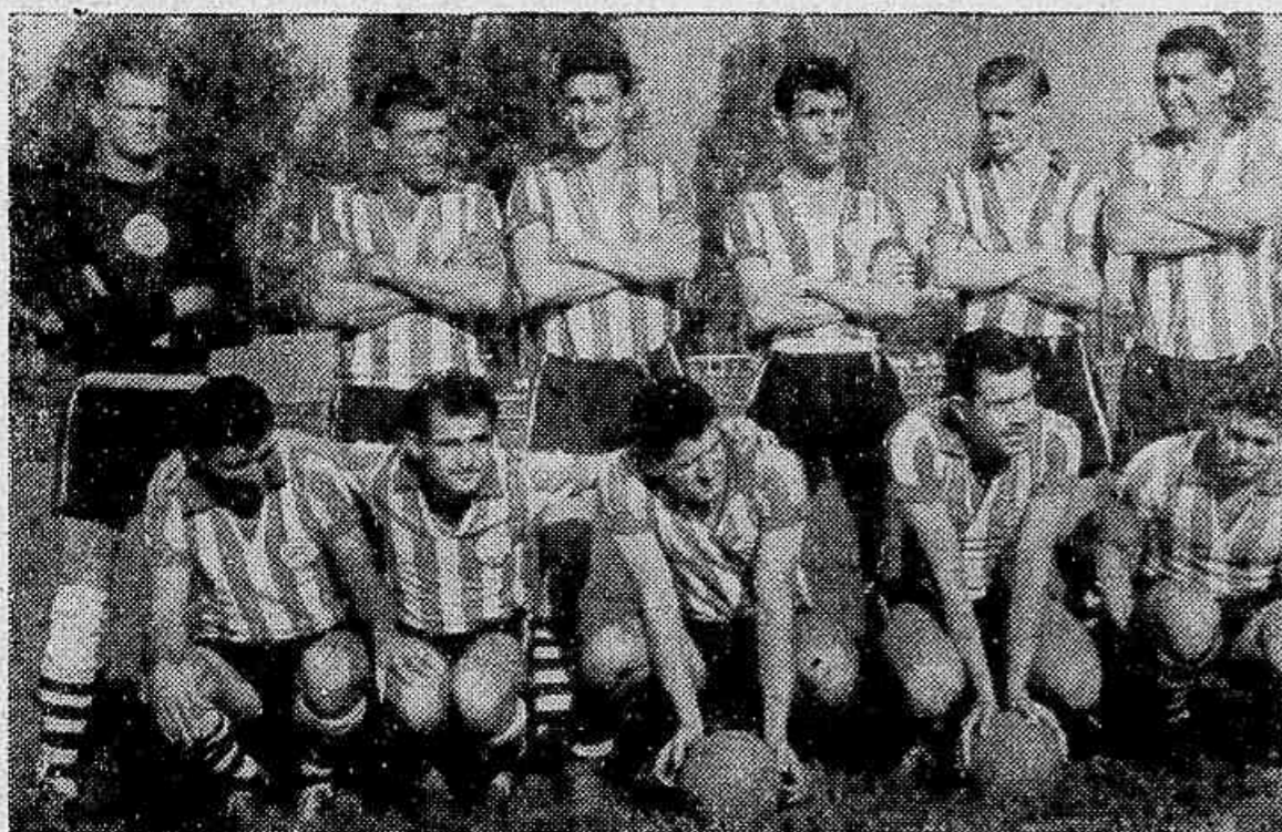
A equipe Coritibana, que terá domingo o seu grande jogo do retorno contra o Agua Verde. Entre Ivo e Oda, Hortêncio vacila na escalção do chefe de ataque.

Confirmaram-se as previsões e não houve nenhuma dificuldade — (Texto na 3.ª pg.)