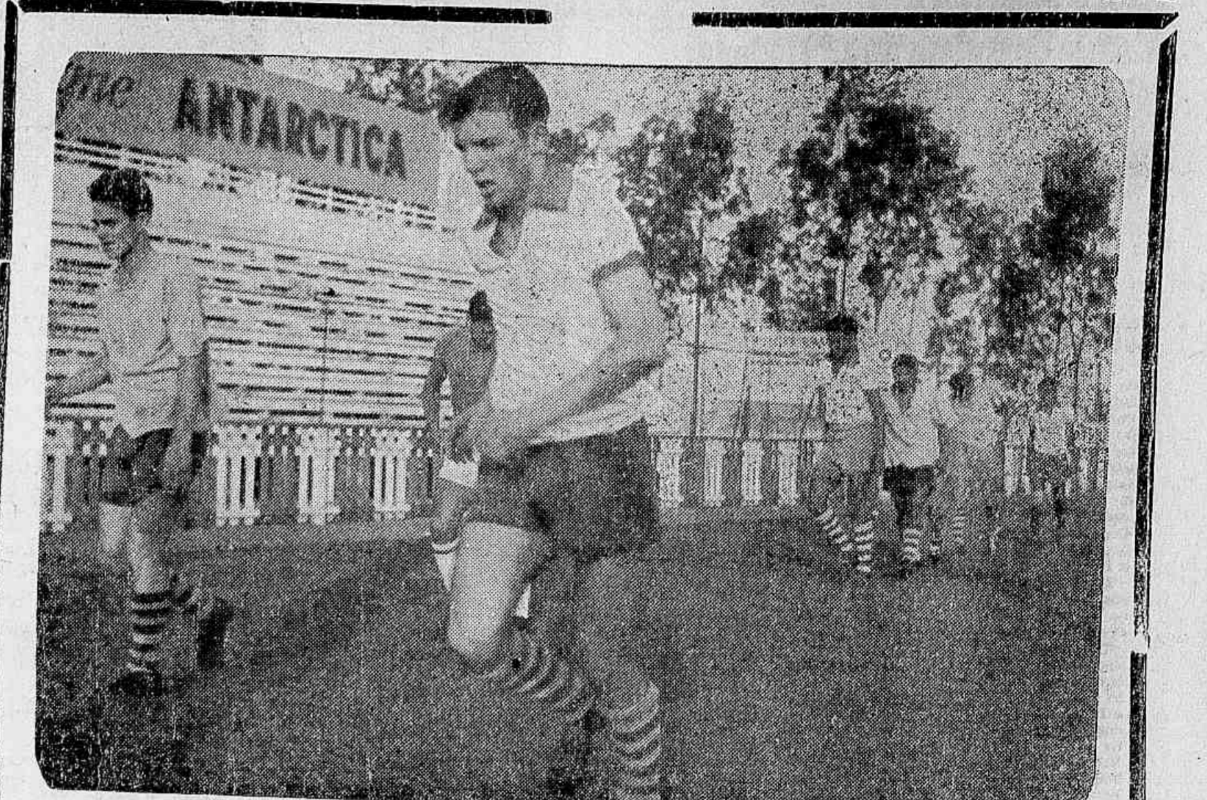
Agua-verdeanos, fotografados em pleno preparo para a grande batalha que se anuncia para domingo contra o Coritiba

Tarefa gigantesca porque o mal dos Colorados é um mal de espírito. Mas confiante, honesto e dedicado, ele não admite a possibilidade de fracassar nessa colossal empreitada.