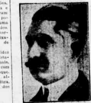
Sr. Estacio Coimbra

RIO, 4 (Gazeta) — O sr. Estacio Coimbra foi reconhecido e proclamado governador do Estado de Pernambuco.