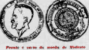
Fronte e verso da moeda de Medico Sorocabano

50 centavos, equivalendo a 20000 — prata; 25 centavos, equivalendo a 10000 — prata; 10 centavos, equivalendo a 3000 — nickel;