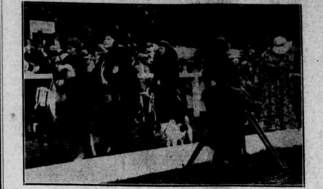
Realizoso recentemente em Vienna um certamen de belleza e elegancia sob a denominação de "A dama e o cachorro", ao qual compareceram as damas mais elegantes da Hunaria. Nesta photographia vemos um grupo de senhoras desfilando deante do jury.