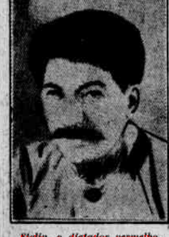
Stalin, o dictador vermelho.

BERLIM, 11 (B) — O "Deutsche Allgemeine Zeitung", diz ter obtido de fonte insuspeita a noticia de que o sr. Stalin assumiria brevemente a direcção politica da Russia, encavalgando-se da