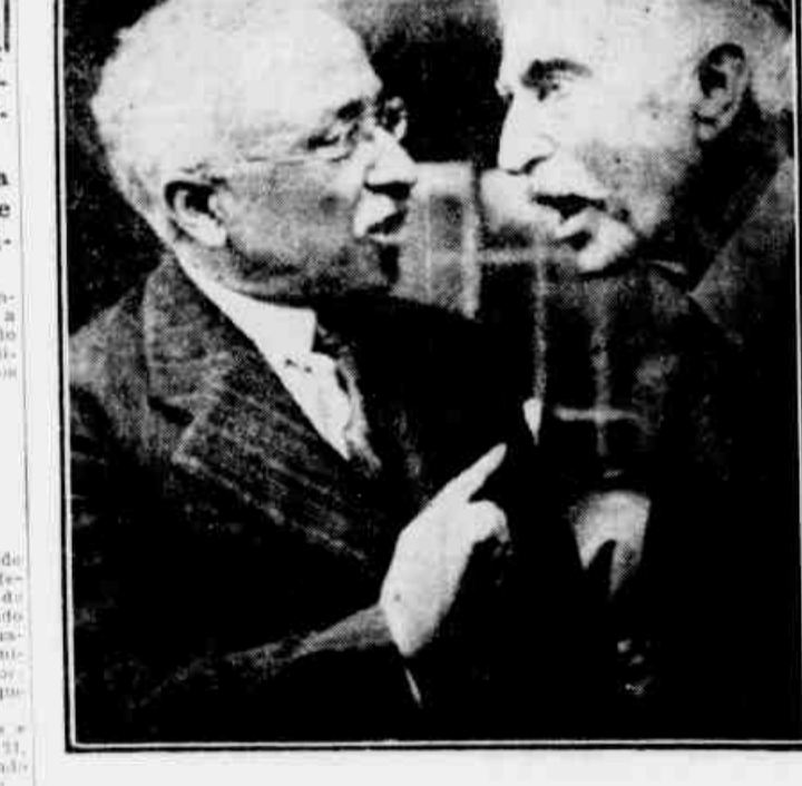
Alfonso Zamora, presidente da segunda Republica hespanhola, e coronel Macia, presidente da futura republica catalã.

Na cidade de Carlsbad foram eleitos socialistas. Os resultados das eleições em Carlsbad accusam uma grande maioria para a chapa socialista. O Sr. Macia obteve a maioria dos votos, enquanto o Sr. Lerroux obteve 386 votos.