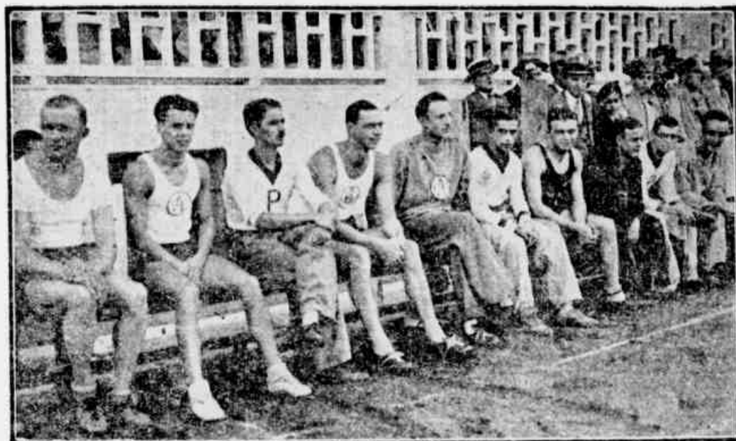
Athletas paulistas que competirão na IV disputa da taça "Correio da Manhã".

O Paulistano, o Tieté, o Esperia e o Germania preparam cuidadosamente os seus atletas — O total dos pontos obtidos pelos clubes concorrentes até agora