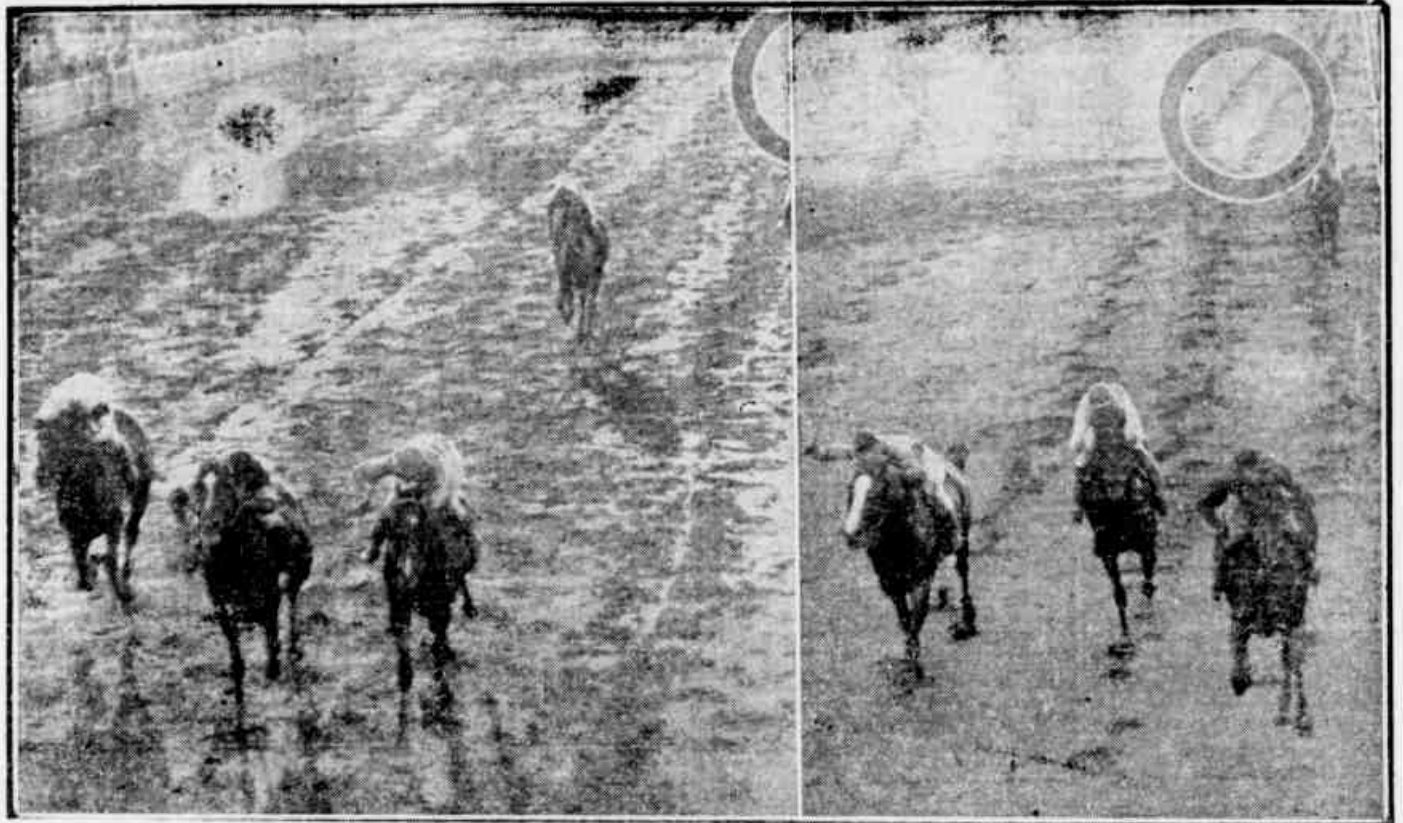
As e Falcão lutam unida na final do pareo "Combinação"; e a chegada de Alegria no premio "Hippodromo Paulistano"