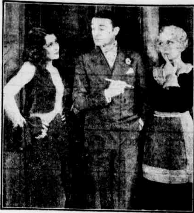
O quartetto formidavel — já sabem — Billie Dove, Clive Brook, Sidney Blackmer e Lella Hyams, apresenta-se hoje na Sala Vermelha do Odeon, com o filme da Warner Brothers First National, "Espoços e namoradas" (Sweetheart and Wives)