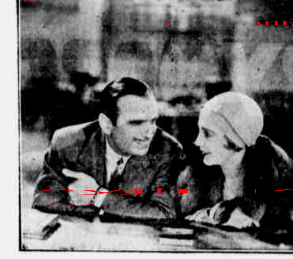
Styrencheta primate e Novero via apêndice 'O Principe dos Dolares'...