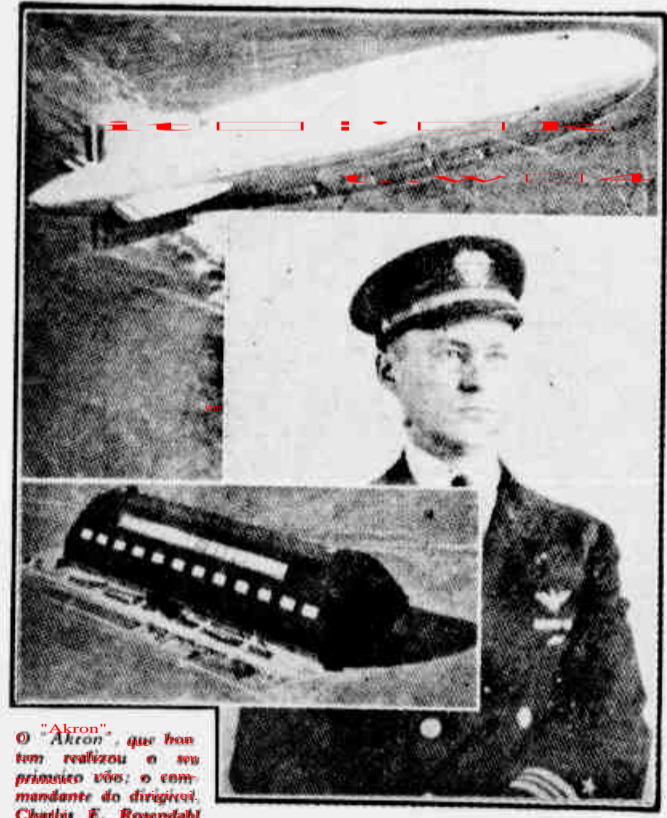
"Akron", que hontem realizou o seu primeiro vôo: o comandante do dirigivel, Charles E. Rosendahl...