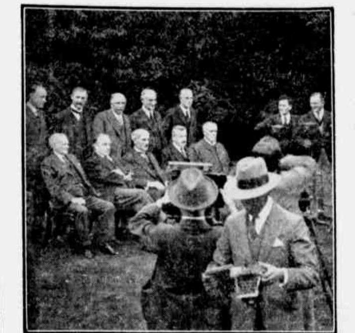
Os membros do gabinete do conservador nacional presidido pelo sr. Macdonald. Vem de esquerda para a direita: o sr. Snowden, secretário do Tesouro; Baldwin, líder do partido; Macdonald, chefe do gabinete; Herbert Samuel, secretário do Interior; e Lord Sankey, líder da oposição.

As lições que nos oferece a Inglaterra, não são apenas do ordem material, mas, sobretudo, do ordem moral.