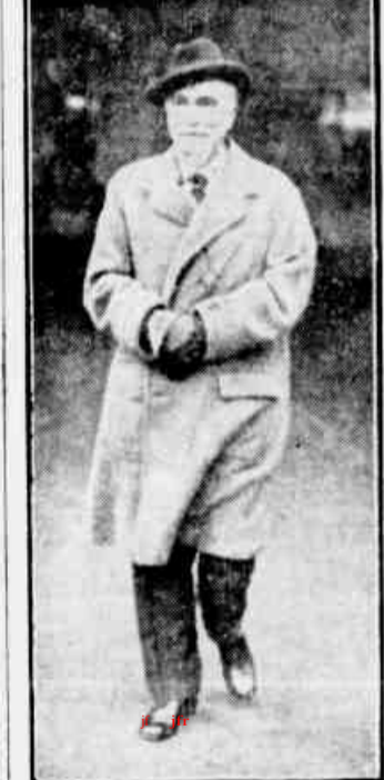
Sr. Montagu Norman, presidente do Banco da Inglaterra

Não parece que as autoridades patelistas devam considerar sem um profundo e necessário exame os factos ultimamente ocorridos em Santos com os estivadores e que agora culminam no assassinato do presidente da Associação da classe.